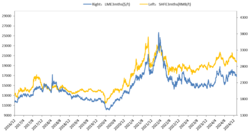
伦敦金属交易所 (LME) 和上海期货交易所 (SHFE) 铝价走势情况

2024 年，全球经济温和复苏，各国家/地区的经济增长分化明显。发达经济体中，美国经济增速相对较快，而日本和欧元区经济增长乏力。新兴和发展中经济体中，亚洲表现较好，尤其是印度和越南，经济增长速度显著。在经济持续复苏的带动下，2024 年 LME 铝价重心有所上移，LME 现货月和三月期铝平均价分别为 2418.90 美元/吨和 2457.50 美元/吨，较 2023 年同期分别增长 7.50% 和 7.40%。（数据来源：北京安泰科信息股份有限公司，以下简称“安泰科”）