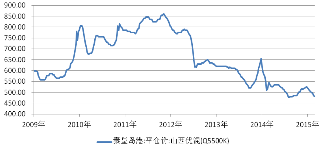
图 2 2009 年 1 月-2015 年 2 月动力煤价格走势