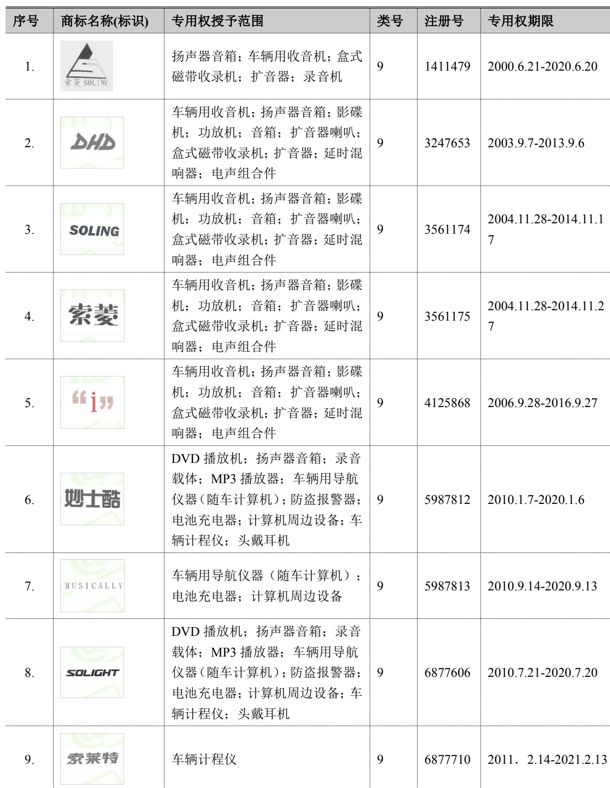
附件二：《深圳市索菱实业股份有限公司注册商标专用权情况表》