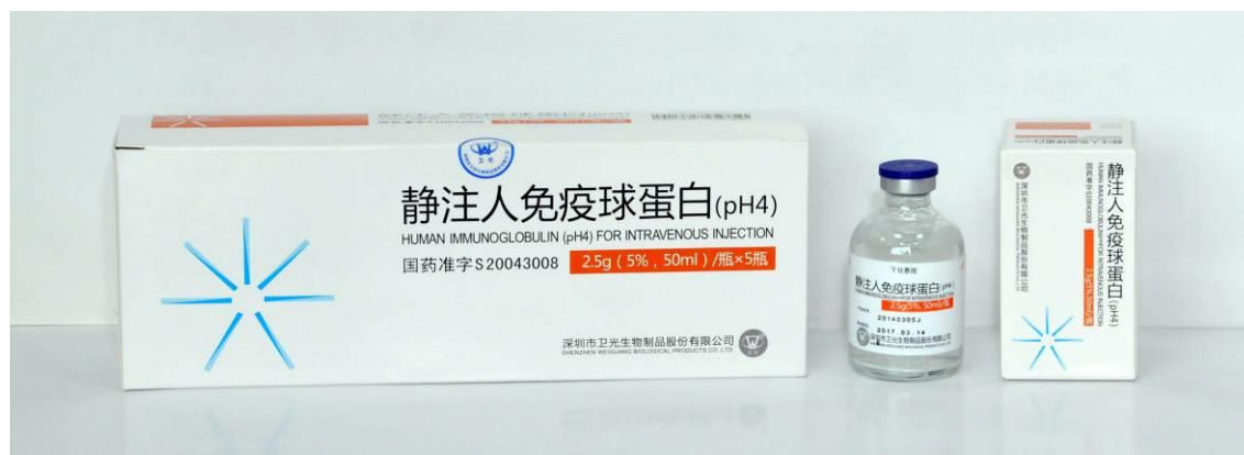
卫光生物静注人免疫球蛋白（pH4）产品图

静注人免疫球蛋白（pH4）含有多种免疫球蛋白，静脉注射后能迅速提高患者血液免疫球蛋白水平，从而增强机体的抗感染（病毒、细菌及其它病原体）能力和免疫调节功能。主要适用于原发性免疫球蛋白缺乏症、继发性免疫球蛋白缺陷病、自发免疫性疾病等。