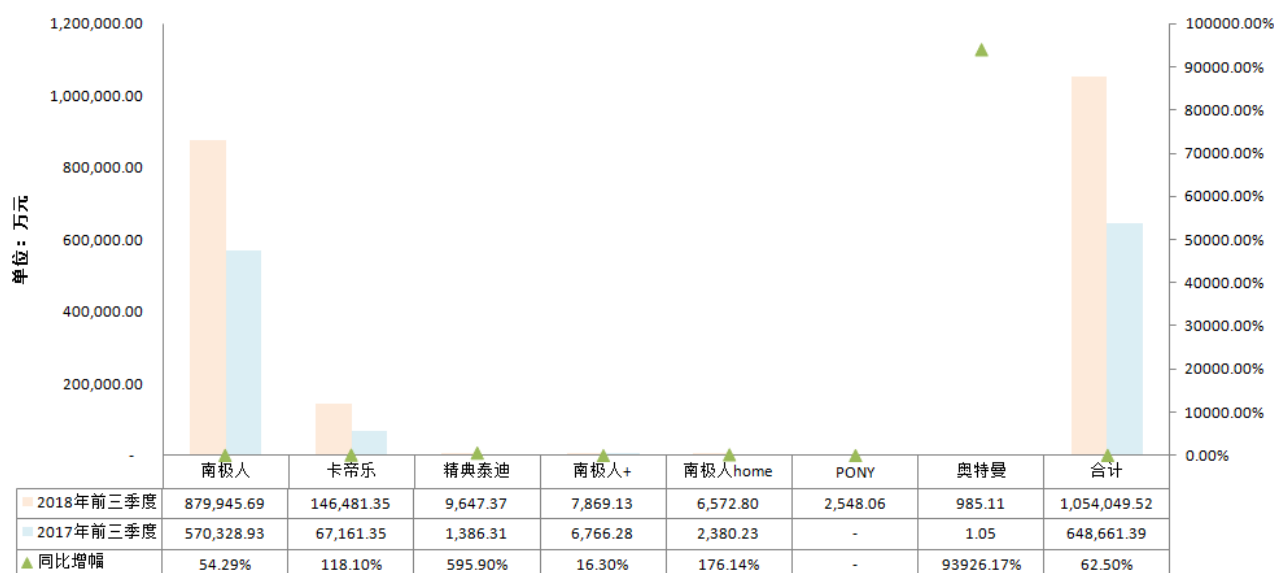
2018年前三季度各品牌GMV同比情况

2018年前三季度，公司旗下各品牌GMV持续增长。公司授权品牌产品的可统计GMV达105.40亿元（包含可统计的电商渠道及电视购物渠道），同比增长62.50%。从品牌维度看，南极人品牌实现GMV87.99亿元，同比增长54.29%；卡帝乐品牌实现GMV14.65亿元，同比增长118.10%；从平台维度看，在阿里、京东、拼多多实现的GMV分别为73.78亿元、19.48亿元、9.29亿元，同比增幅分别为63.49%、26.14%、210.42%。