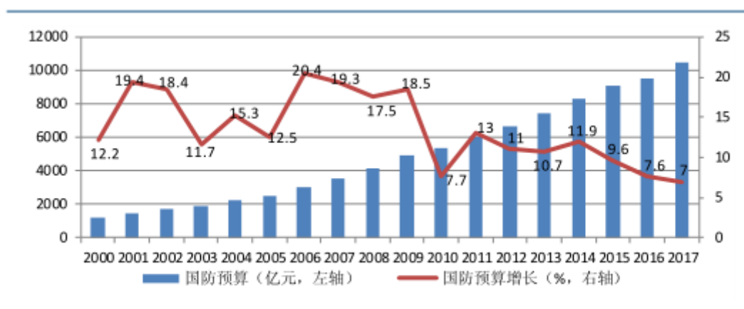
2000 年-2017 年中国国防预算

预算达到 9,543.54 亿元，比 2015 年增长了 7.6%。2017 年中国财政拟安排国防支出 10,225.81 亿元，比上年执行数增长 7%，2018 年国防支出预算 11,069.51 亿元，同比增长 8%，我国国防预算总额远低于美国 2015 国防预算 5,850 亿美元；我国人均国防支出仅 100 美元左右，远远低于美国的 1,820 美元；同时我国军费占政府支出、GDP 比重均较低，所以未来我国国防预算将依然保持在一个较高的增长水平。