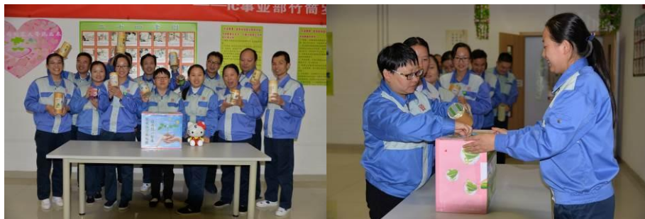
图为定期进行竹筒岁月回娘家，点滴善款聚沙成塔

每一件事情的圆满，背后都有家人们在默默的付出。每一次的慈善众筹、每一次的小区倡导，每一次的爱心助学，哪里有需要，哪里就有他们的身影！