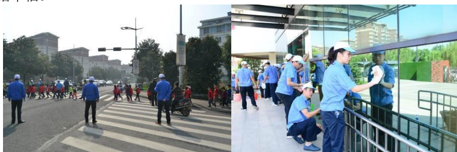
图为公司志愿者进行护学岗及园企共建活动

公司倡导人人都是志愿者，积极培养公司志愿工作者以及幸福志工推广，让家人们真正明白志愿者的意义与使命。公司志工是幸福企业八大模块的实践团队，幸福志工的职责是义务协助更多的企业、社区、学校等进行幸福典范创建，引导更多行业懂得以员工的幸福为第一要务，同时知道如何去落实。苏州固得期盼引领更多的企业、社区、医院、学校等更多的团体都开始真正落实幸福的理念并承担社会责任，让我们的社会更加和谐幸福。