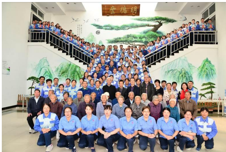
图为：公司定期举行的黄金老人、幸福宝宝幸福感恩会

我们要进行多岗位、轮转学习、交替的进行人文教育。那么学习过后我们要怎么做，我们要坚守诚信，重点落实因果的教育，让大家能够真正明理。