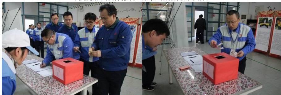
图为大家自觉捐款，向困难员工表达我们诚挚的问候