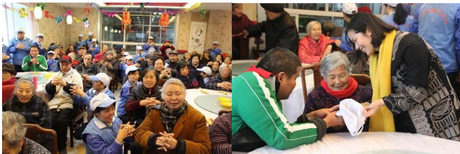
图为走入敬老院关怀抚慰年迈长辈，把天下的父母视作自己的父母

心灵温暖的港湾，风雨兼程，我们永远与您相伴……每个人伸出援手帮助需要帮助的人，用自己的点滴付出，换得更多人的幸福；对于弱势群体而言，物质的帮助是暂时的，心灵的抚慰更重要。固得志愿者期盼把天下的老人视为自己的老人 把天下的孩子视为自己的孩子。让这个世界充满爱和温暖。小到爱物惜福，大到敬天爱地。