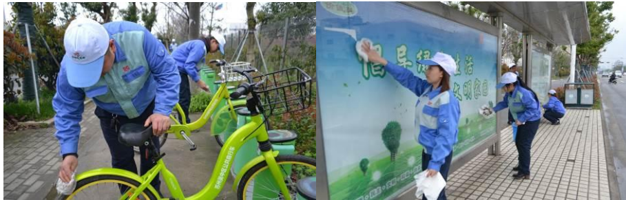
图为家人自觉维护和清洁公共设施，用自己的实际行动告诉大家要爱护公物

在敬老院和儿童福利院的常态关怀基础上，各支部自发组织净山、净街、清洁公交站台、清洁公共自行车，呵护工厂周边地区。