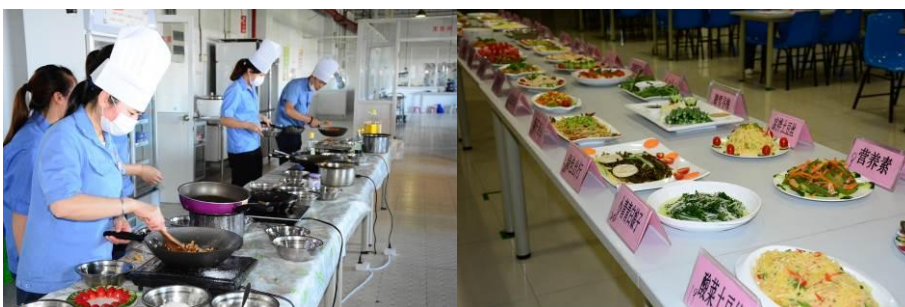
图为健康低碳餐厨艺比赛精彩瞬间

健康是我们人类永恒的话题，在 21 世纪的今天，健康更是人们关心的热点话题。因为健康的成本越来越高，疾病的负担越来越重，而健康又是我们生活中最重要的元素，如果没有了健康，何谈幸福安康。