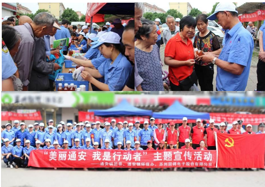
图为走进社区进行废旧电池回收，并进行环保宣导

推行绿色采购、绿色设计、绿色制造、绿色销售的 4G 经营理念，将生态环保落到实处。