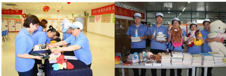
图为向贫困地区捐赠衣物图书，我们献一份爱就能带给他人一些温暖

爱是一种无声的承诺，只要轻轻一点火花，就能让世界充满温暖！作为固得志愿者，我们坚定的把爱心化为行动，去关爱社会上每一个需要帮助的人。