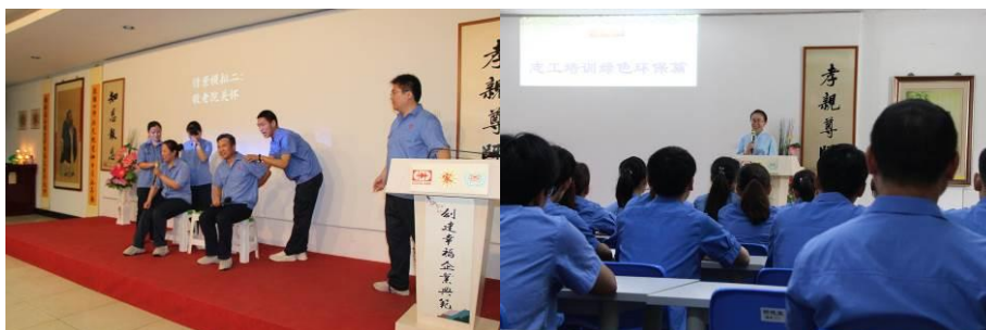
图为定期进行志工培训

爱是一种无声的承诺，只要轻轻一点火花，就能让世界充满温暖！作为固得志愿者，我们坚定的把爱心化为行动，去关爱社会上每一个需要帮助的人。