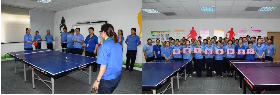
图为定期举行“乒出快乐，搏出健康”杯乒乓球友谊赛

为了进一步丰富家人们的业余生活，增强员工的体质，加强互动交流，提高团队协作精神，定期举行“乒出快乐，搏出健康”杯乒乓球友谊赛及趣味运动会等。