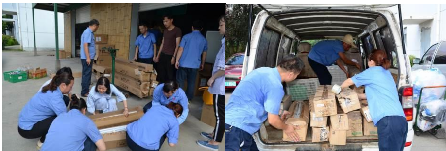
图为回收的废旧灯管送专业部门进行集中处理

废旧电池，废旧灯管的统一回收处理、资源再利用；全员低碳出行，制作、使用和推广环保酵素，节能减排，尊重自然与生命，心物一体的生态观已落地生根。