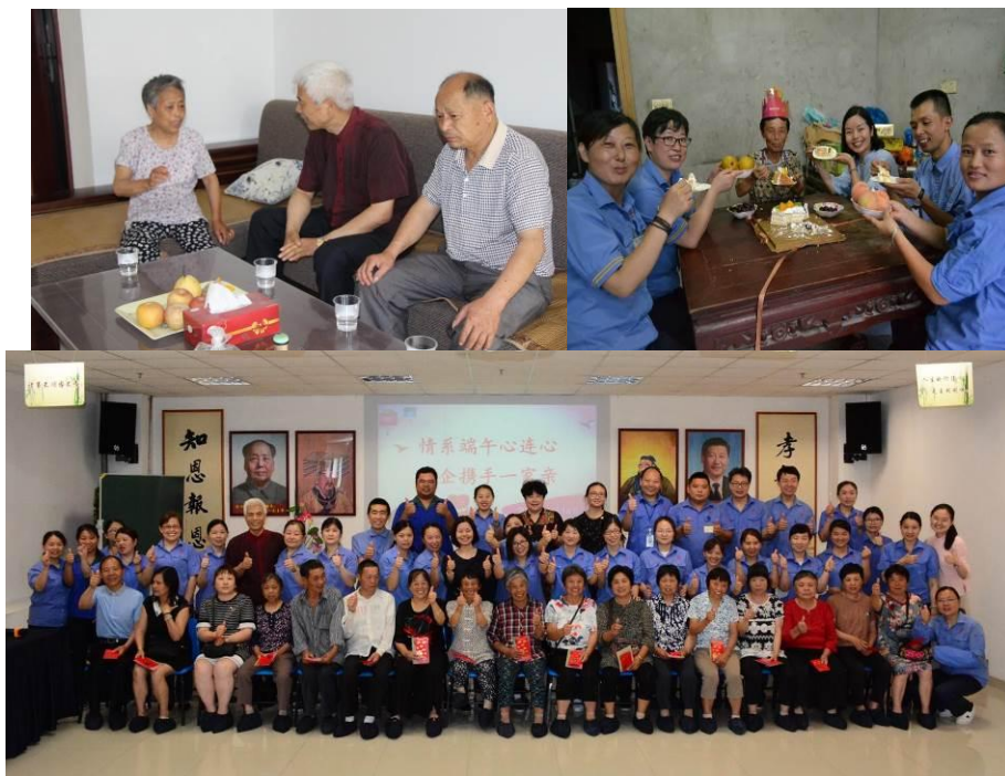
图为公司志愿者进行护学岗及园企共建活动

付出无所求，还要真感恩，幸福自然来。让我们启动内心的爱，把爱传出去，让世界因为有我而变得更美丽。