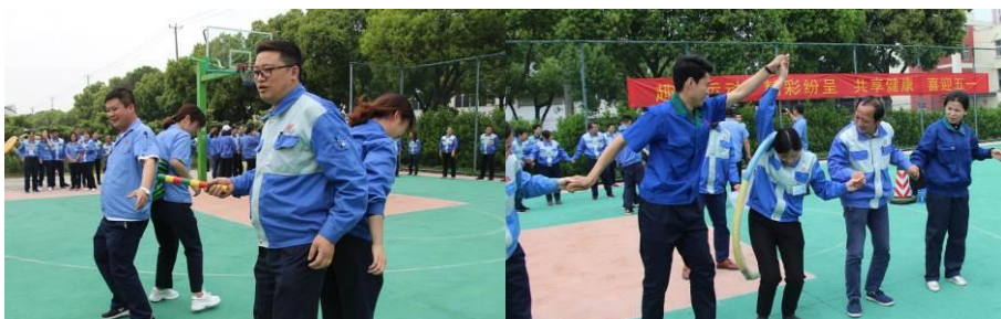
图为定期举行的趣味运动会

健康是什么？健康是我们幸福人生的基石，也是我们幸福企业八大模块建设的重要基础。“身体发肤，受之父母，不敢毁伤，孝之始也。”《孝经》里的这句话让固得家人懂得，要照顾好自己的身体，不让父母担心。持续的人文教育学习，也让全体固得家人明白“上医治未病”的道理。