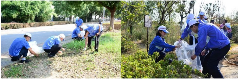
图为大家长吴董带领大家净街净山