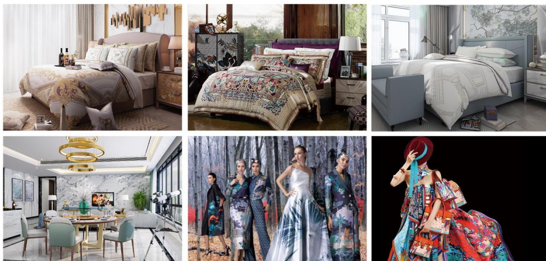
（图三：公司设计风格的产品图片）