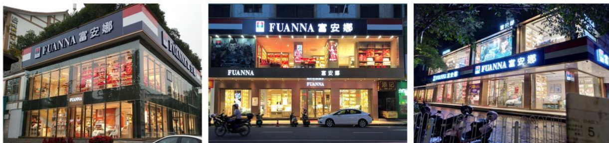
（图二：公司专卖店图片）

公司采取自主品牌经营模式，以带给消费者高品质、个性化的消费需求为核心理念，以研发、设计产品为核心优势，以直营、加盟和电商三大网络营销渠道，通过多个不同定位的自主品牌，持续提升产品设计开发、供应链管理、营销网络的竞争力，公司多渠道营销网络布局结构均衡。