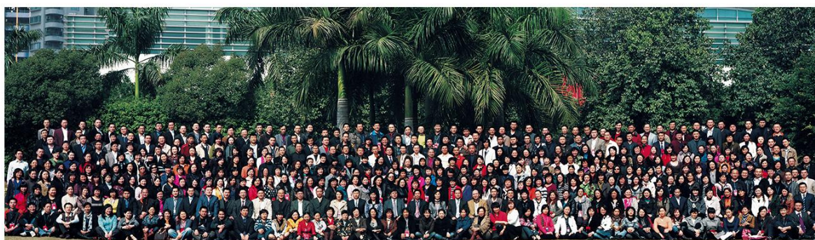
深圳市富安娜家居用品股份有限公司 2018 年全国销售工作会议