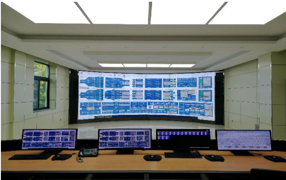
水务智能化管控平台

公司积极开展清洁能源利用，结合旗下的污水处理厂高耗电的特点，创新发展“水务+光伏”模式，利用初沉池、二沉池、生化池等构筑物上方空间建设分布式光伏电站，为生产运营节