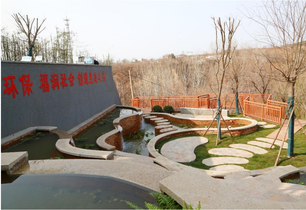
新密市岳村镇竹杆园村污水处理点景观