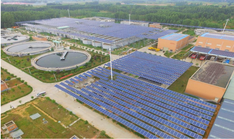
港区二污水务分公司“水务+光伏”项目

约电费成本、节能减排的同时，通过光伏板的遮挡有效抑制池中藻类生长，实现了经济效益、社会效益、生态效益多赢共荣的局面。