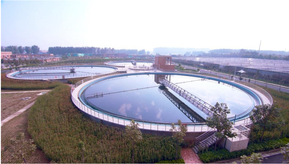
马头岗水务分公司

药系统等专利技术，在保障稳定运行的同时不断提升处理效率，降低资源消耗。公司各生产单位自建成运营以来，均实现达标生产、达标排放，为所在地的生态环境保护和建设做出重要贡献。