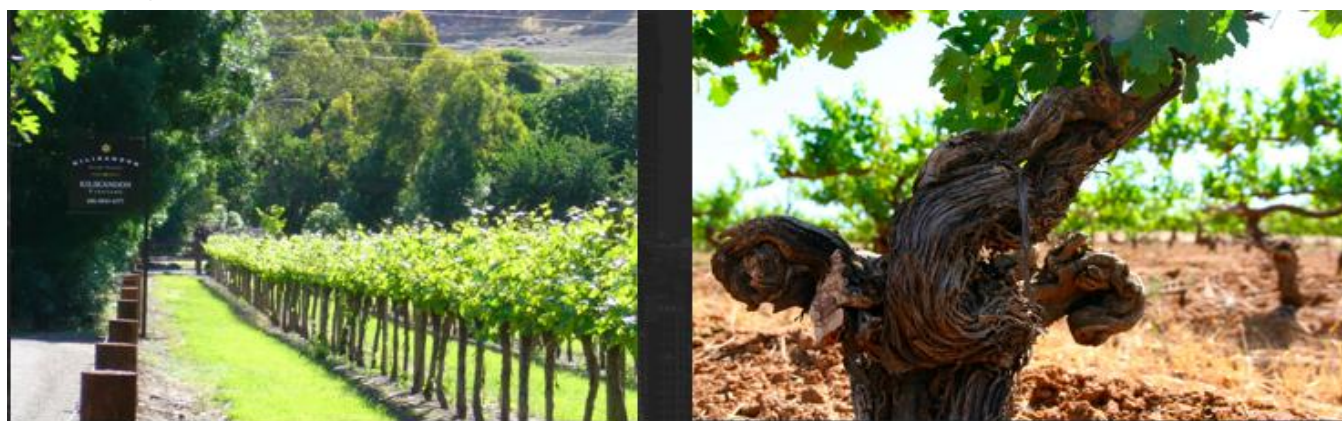
歌浓酒庄葡萄园一角