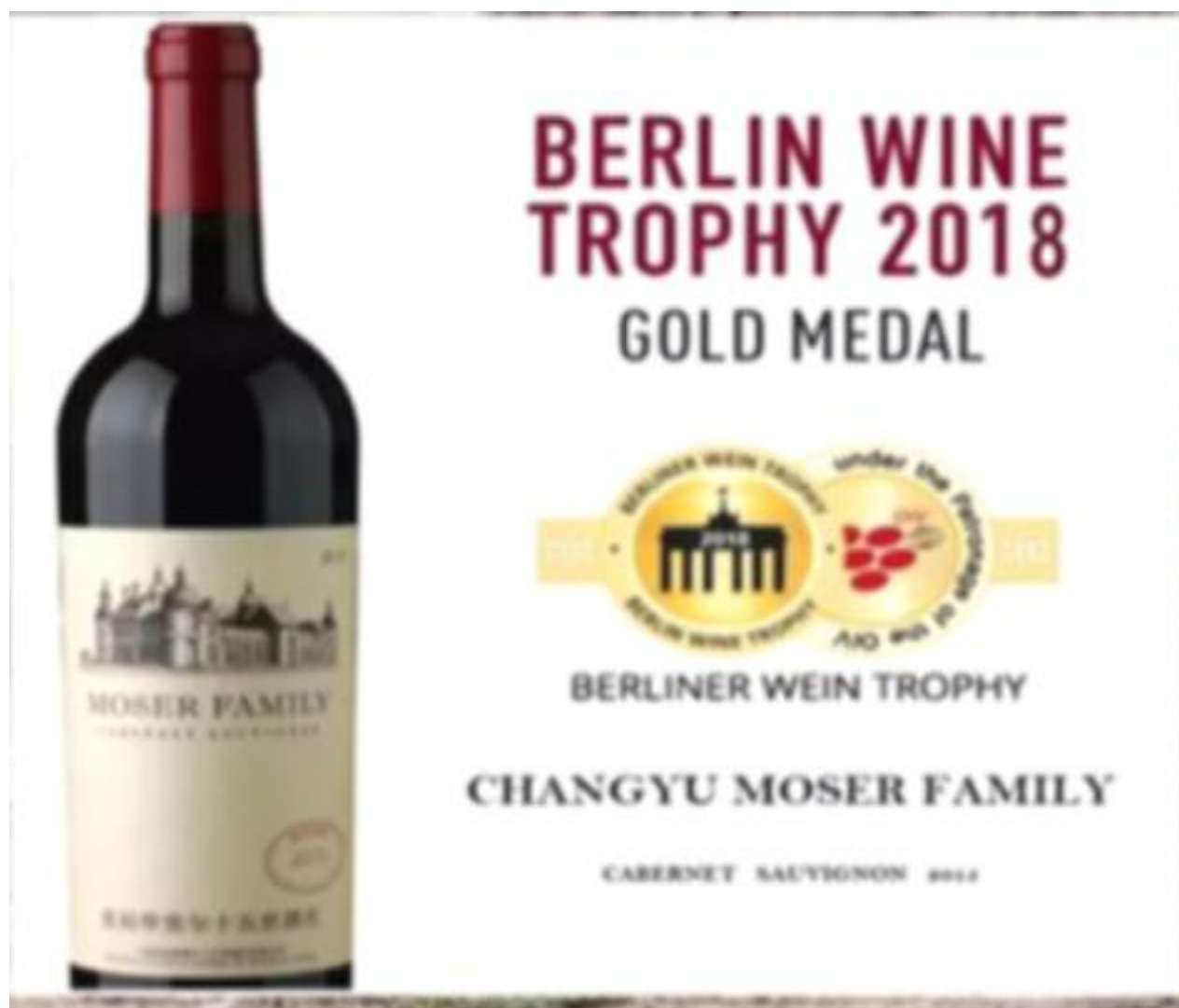
张裕摩塞尔十五世酒庄斩获 3 枚金奖