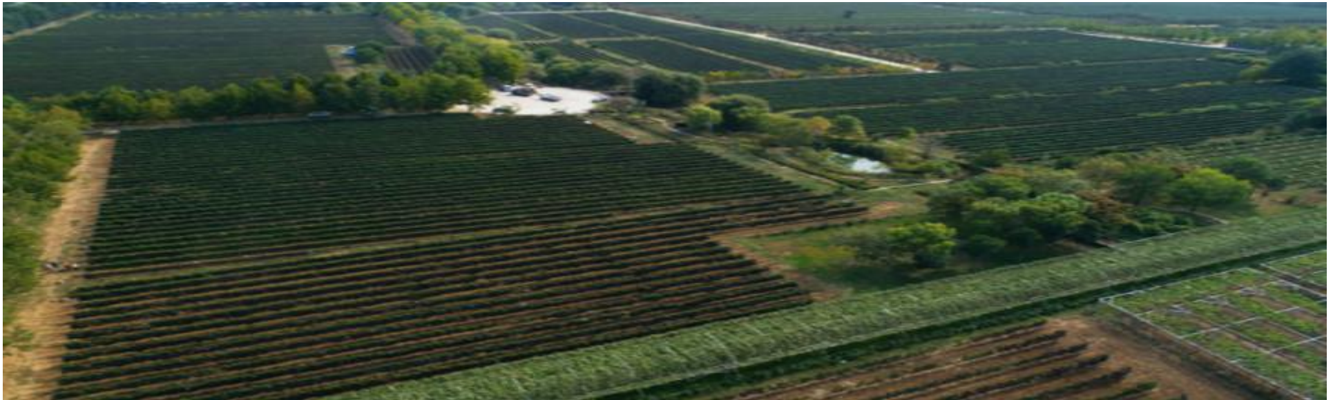
公司新建葡萄园一角