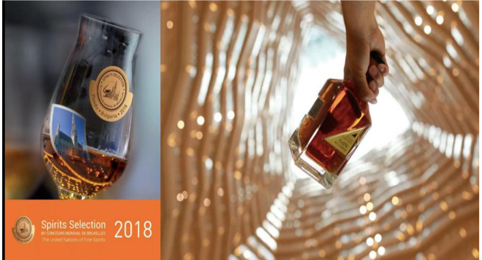
珍藏版五星白兰地获 2018 年布鲁塞尔国际烈酒大赛金奖