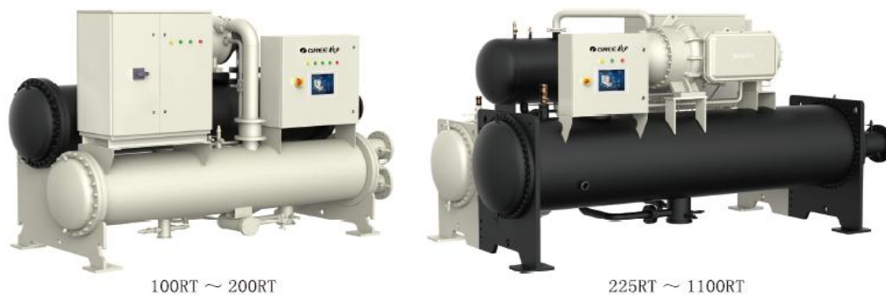
图 1：格力磁悬浮变频离心式冷水机组

以及四象限变频等核心技术，使机组满负荷 COP 达到 7.19 W/W，综合部分负荷性能系数 IPLV 达到 12.06 W/W。目前该产品成功应用于广东省经济和信息化委员会机关服务中心、越南万盛发、宁波巨发电机等工程项目。格力永磁同步变频螺杆式冷水机组，采用格力自主研发的 GRZ 双驱动转子，搭载永磁同步电机、转速-容积协同控制、多层均液混合降膜式蒸发器、内置油分卧式冷凝器等多项技术，产品性能大幅度提升，机组满负荷 COP 达到 6.07W/W，AHRI 工况 IPLV 达到 11.26W/W，比 LHE 系列产品提升 40%，2018 年经中国机械工业联合会鉴定达到“国际领先”水平。目前该产品已应用于新加坡、巴基斯坦、北京、重庆、湖南、广东、湖北、上海等国内外多个大型工程项目。