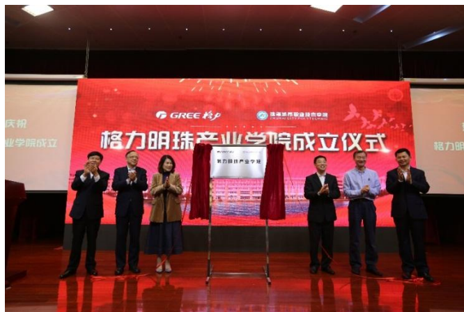
图 7：格力明珠产业学院成立仪式

2018 年 9 月，格力学校落成开学，公司积极利用政府学位政策，解决公司技术研发人员、管理骨干、双职工等群体子女入学需求，为员工解决后顾之忧，有效提升员工幸福感和满意度。