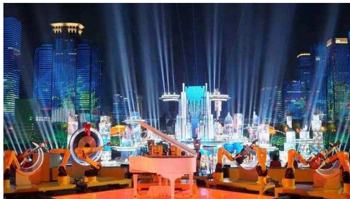
图 6：格力机器人乐队荣登春晚舞台

格力机器人加工精度高、一致性好、运行流畅、响应速度快，可完成高精度高难度的歌曲演奏，并成功登上 2019 央视春晚舞台，与 200 名专业钢琴师同台献艺，搭档朗朗、周华健、任贤齐演奏金曲《朋友》，为亿万观众献上一场别开生面的表演，将工业机器人高效灵活的特点表现得淋漓尽致，同时彰显了格力电器自主创新的不凡实力。