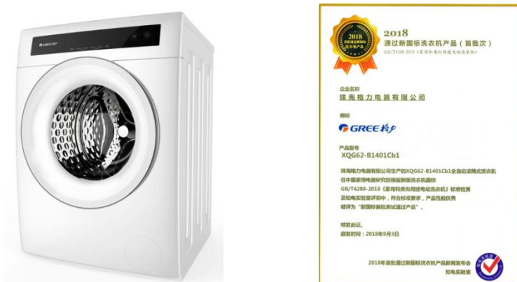
图 5：格力净柔洗衣机

2018 年，格力开发的净柔洗衣机首批通过国家新国标测试认证，及国家静音认证，具有全新防霉抗菌门封设计，经中国科学院理化技术研究院检测，抗菌率达到 99%。此外，利用动态空间分布衣物技术，使单件衣物的脱水成功率提高了 60%，同时节约时间和电能。针对现有技术中洗涤剂盒操作不方便以及与机体连接不稳定等问题，净柔洗衣机首创洗涤剂盒多连接设计，将多个连接部共同连接以稳定机体；针对消费者衣物高洗净度的需求，自主研发、设计仿搓衣板架构，设计上充分利用玻璃碗与衣物的接触，在玻璃碗处以蜂窝型凹凸内纹模拟搓衣板效果，通过增大揉洗力度和增加揉搓次数，洗脱顽固型污垢，增大衣物的洗净度，提高洗净效果，且平滑玻璃可起缓和作用，可减少衣物造成的损伤；针对洗衣噪音大的痛点，净柔洗衣机在减少噪音方面进行深入研究并不断改善，使用框架静音法与动平衡系统设计。