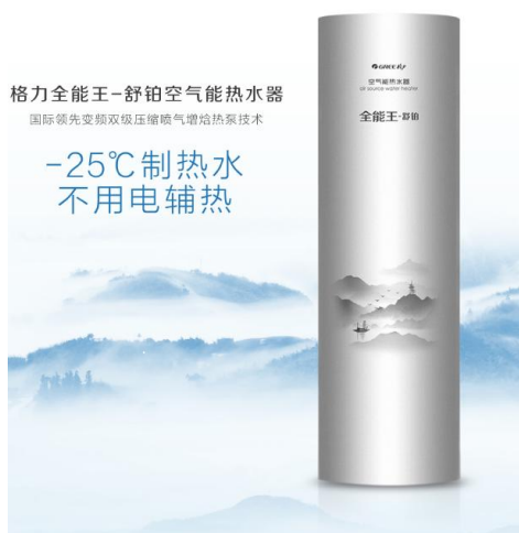
图 3：格力全能王-舒铂空气能热水器

格力开发的“格力冷链”智能监控平台，集智能监控、参数设置、机组选型、故障诊断及上报、产品推广、AI 问答等功能于一体，依托微信界面为用户提供一个实时监控冷库运行状态的监控平台，属行业首创，已累计为 3000 多用户服务。平台可实现三级服务控制管理，一级服务于企业，通过大数据分析实现机组集团化管理；二级服务于经销商或工程商，通过分类统计实现机组工程化管理；三级服务于客户，实现随时随地查看机组运行状态及货物储存状态。