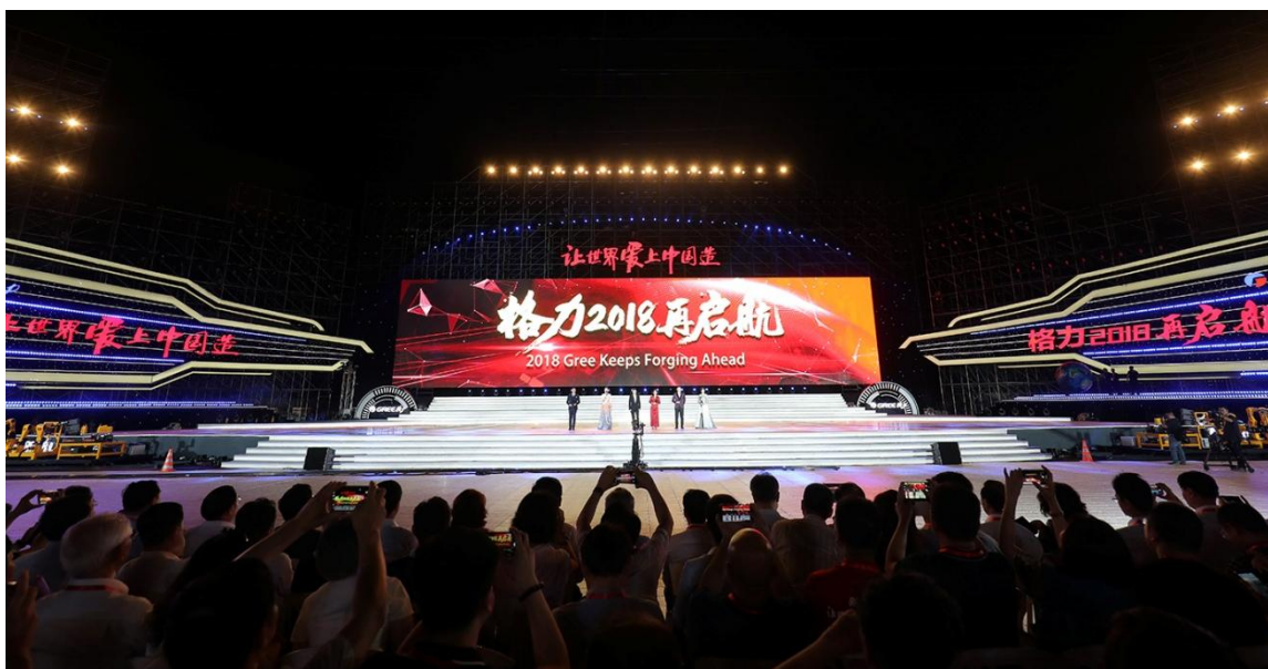
图 14：2018 年 5 月 16 日“格力 2018 再启航”梦想盛典大型晚会

公司组织策划 2018 格力电器“舞动元宵，点亮新春”游园会，现场参与互动人数高达千人，充分利用新媒体技术实现现场直播盛况。2018 年正值改革开放四十周年之际，为响应党和国家“紧紧围绕将改革开放进行到底”主题，组织“让世界爱上中国造”2018 届大学生合唱比赛，开展形式多样的群众性主题宣传活动，讲好改革开放的故事。