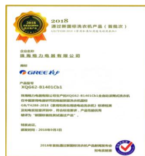
图 7：格力净柔洗衣机《通过新国标洗衣机产品（首批次）》认证证书