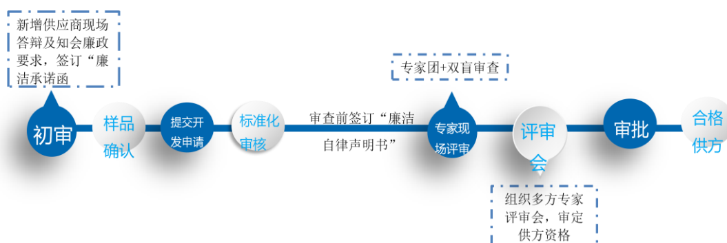
图 16: 供应商开发评审模式

在公司领导的指导下，完善供应商开发模式，建立“专家团+双盲” 供应商开发评审模式，进一步完善了供方开发评审制度，把廉政预防工作纳入工作流程里，形成了“廉洁、正气、专业、高效”的供应链管理的工作标准。具体完善以下流程：