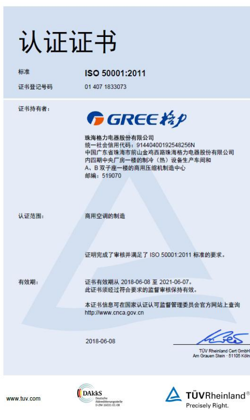
图 17：能源管理体系认证证书