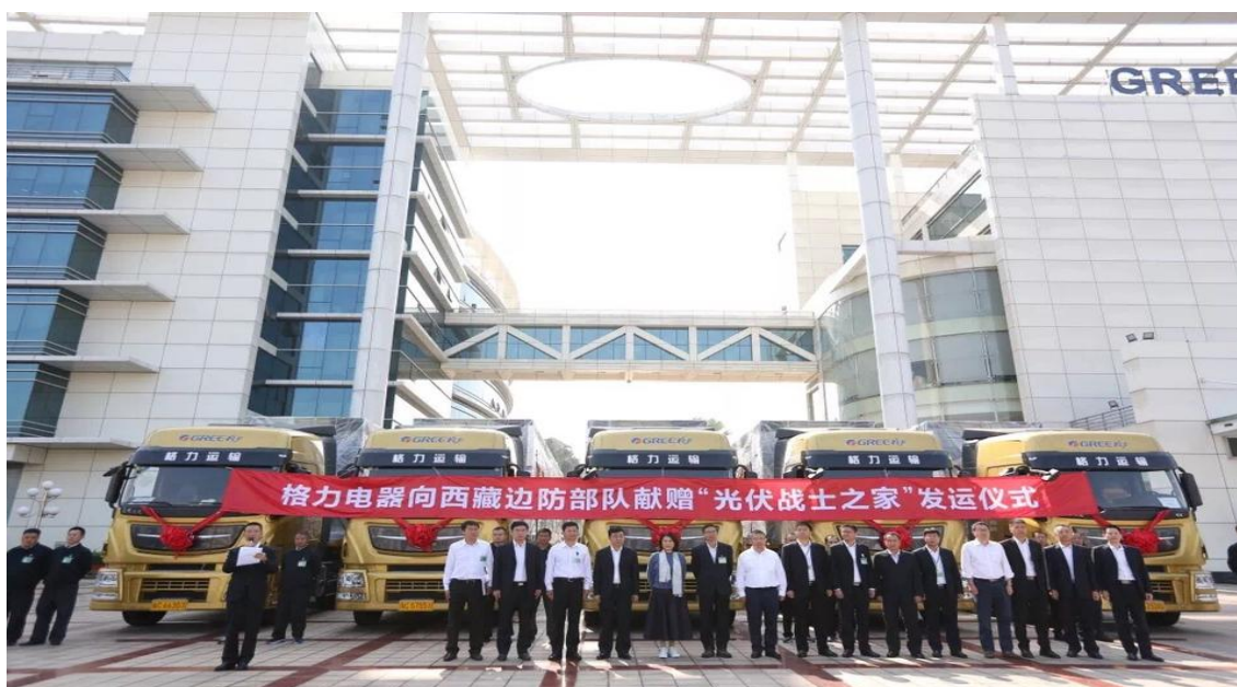
图 18：“光伏战士之家”发运仪式

为了诚挚致敬忠诚奉献、保家卫国的当代军人，格力电器 2018 年 11 月 23 日向西藏边防部队献赠了 10 套“光伏战士之家”，致力改善西藏边防高寒艰苦地区战士的工作和生活条件。