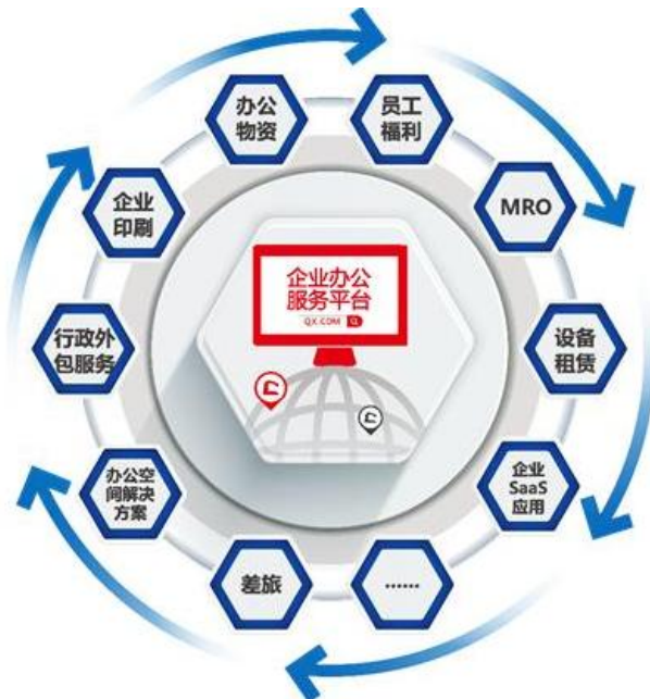
齐心企业办公服务平台概念图

具体而言，公司通过传统业务的电商化把多年积累的客户资源、渠道资源及合作品牌商资源打通，形成垂直行业互联网流量。公司将依托上述流量基础，通过自行研发及外延收购并举的方式，拓展企业级 SaaS 服务，并进一步丰富流量，形成垂直行业生态。此外，公司将不断增加 MRO 类物资、OA 维保服务、员工福利产品等高附加值商品和服务，持续扩大办公物资及办公服务的覆盖范围，增强对客户服务的粘性，为客户提供一站式的“硬件+软件+服务”产品体系，提升公司盈利能力。