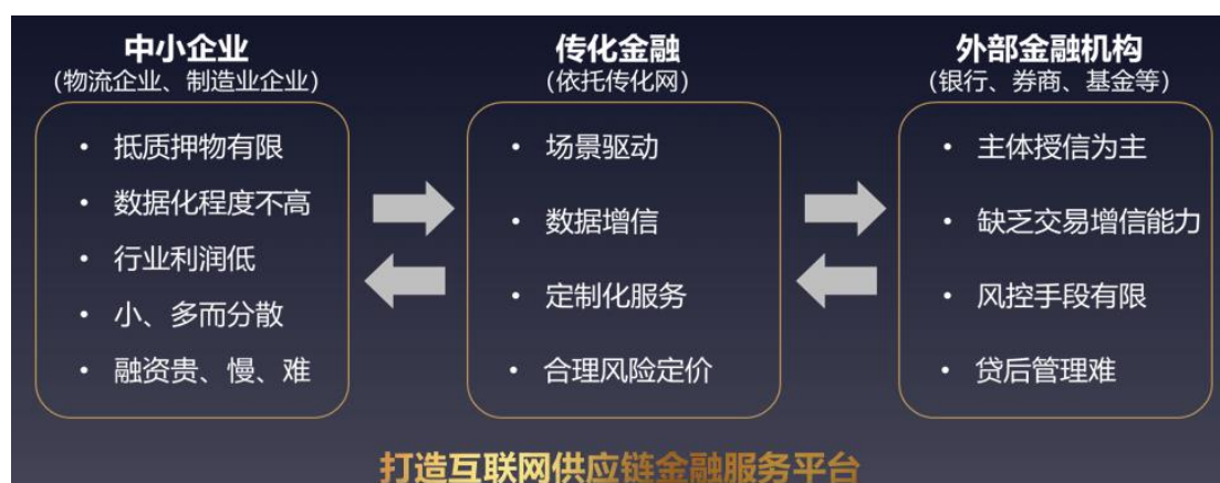
金融服务核心业务产品图示

围绕传化网商流、物流与信息流的综合性服务与数据信息沉淀，以技术为手段、以风控为核心、以数据为驱动，采用平台化的模式开展供应链金融服务。公司利用平台优势，与银联、网联合作，通过交互、链接金融供需方来实现平台交易闭环与物流行业交易大数据沉淀，在增强传化网平台生态粘性的同时，通过支付、供应链金融、保险、理财等业务产品，实现传化网生态价值的变现。