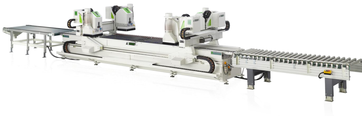
(6) 六面数控钻孔中心