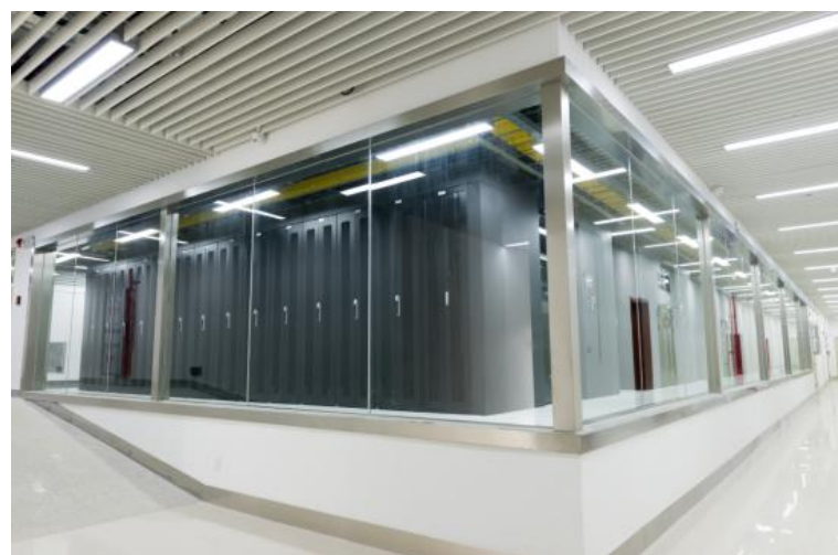
唯一·志享（华南）数据中心