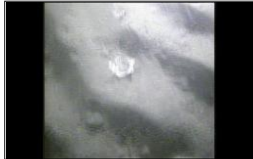
拖网后地形摄像图片