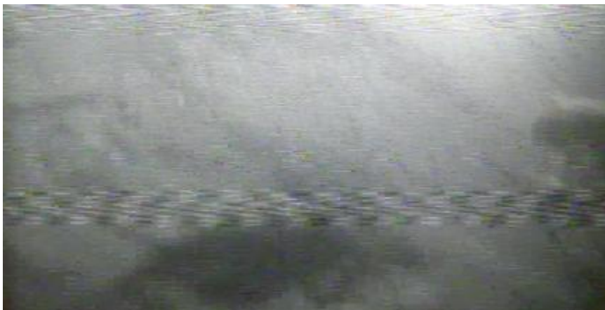
拖网后半年地形摄像图片

对照海域与拖网海域在拖网前即存在区域性差异，因此在判断采捕海域是否发生环境变化时应当将区域性的自身时空变化考虑进去。可以看出，拖网后1天COD和细菌总量出现了一个明显的上升，而超过5天后，所有水质指标趋于稳定。海底水交换可以快速消除拖网对底层水质的影响，如下表：