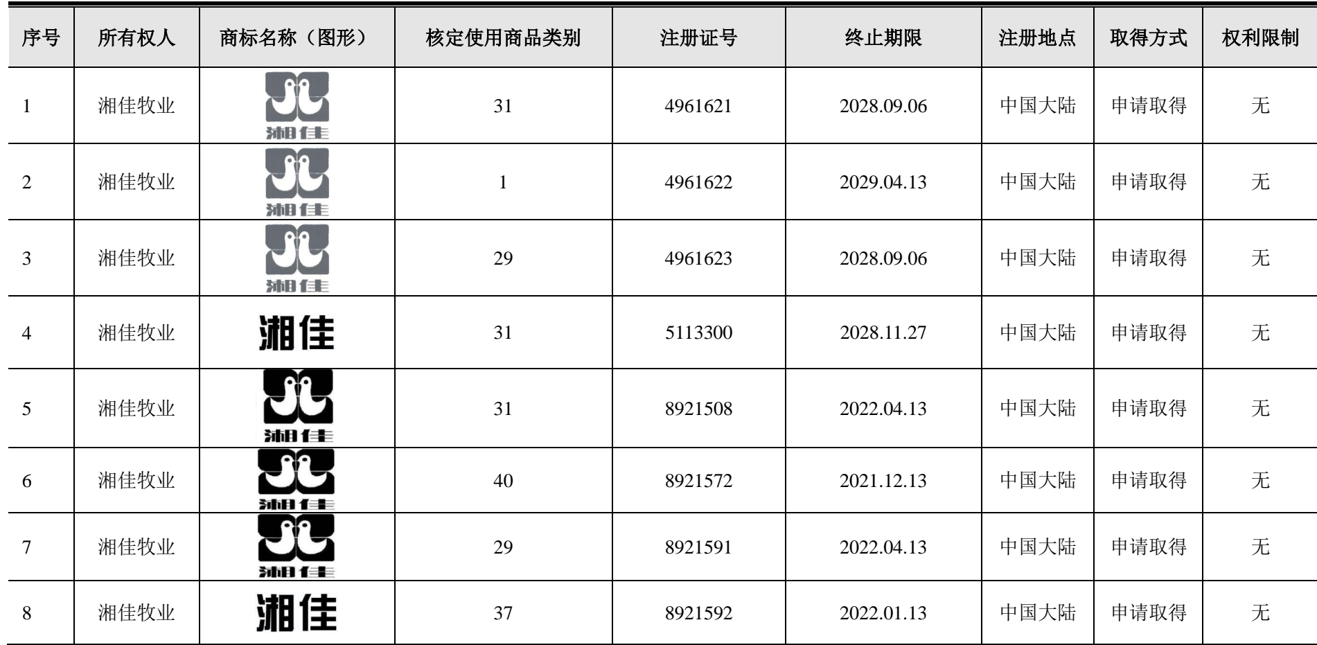
附件四：发行人及其子公司的注册商标统计表