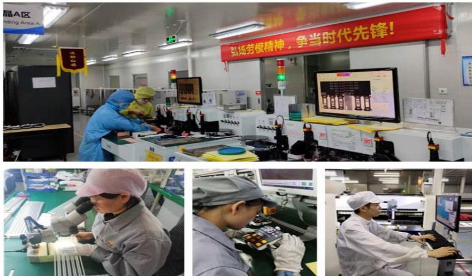
（“质量月改善项目”活动）

公司深入贯彻“全员参与，质量第一，持续改进，为顾客提供满意的产品和服务”的质量方针，高度重视产品质量，不断增强对生产过程的质量把控，完善质量内控标准，提升全员对质量管理重要性的认识和质量意识管控水平。每年开展“质量月”活动，2019年通过专项攻关、劳动竞赛、建言献策等专题活动，实现新品进仓率、生产效率、成品进仓批次合格率等质量指标的有效提高，不断推动供应链管理标准化的落地应用和持续完善，实现工艺优化、品质提升、管理升级，使效益与质量相互促进，形成良性循环，为持续提供满意的产品和服务提供有力的保障。