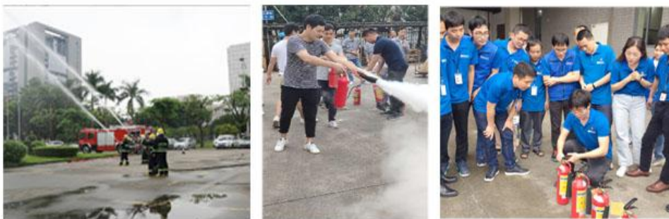
(消防演练、消防培训)

公司积极推进风险分级管控、隐患排查整治的双重预防工作机制建设。建立风险分级管控清单、安全隐患清单，在重要时节，开展各项专项检查、整治活动。另外，公司开展组织安全文化宣传教育、普及安全知识、开展主题班会、安全隐患排查治理和应急救援演练等一系列活动，组织安全环保和消防安全培训 30836 人次，增强了全体职工的安全生产意识和自我防护能力，夯实了安全生产工作基础，有效地预防安全生产事故发生，保障了公司生产经营目标的顺利实现。