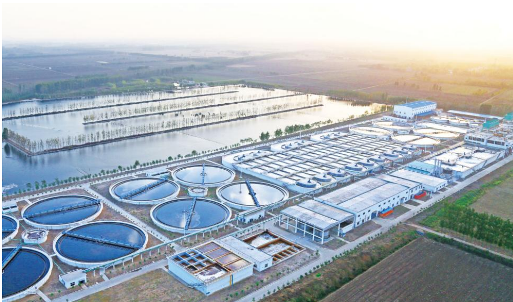
太阳纸业八万方污水处理中心

按照突发环境事件应急预案和防风险评估备案要求，公司编制了突发环境事件应急预案及防风险评估报告，积极组织员工定期培训和演练，不断提升公司在环保方面的应急处置能力。