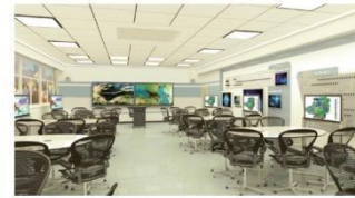
鸿合互动教学解决方案