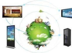
鸿合校园数字媒体发布系统