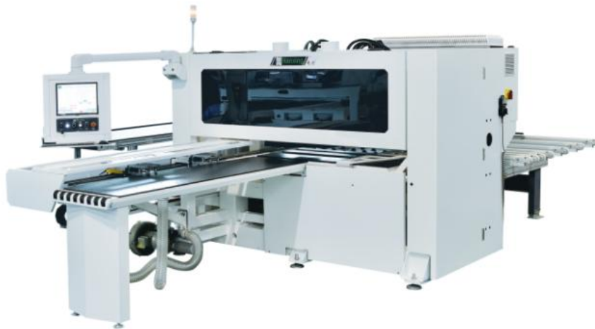
六面数控钻孔中心