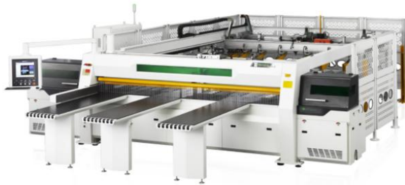
双推手后上料高速电脑裁板锯