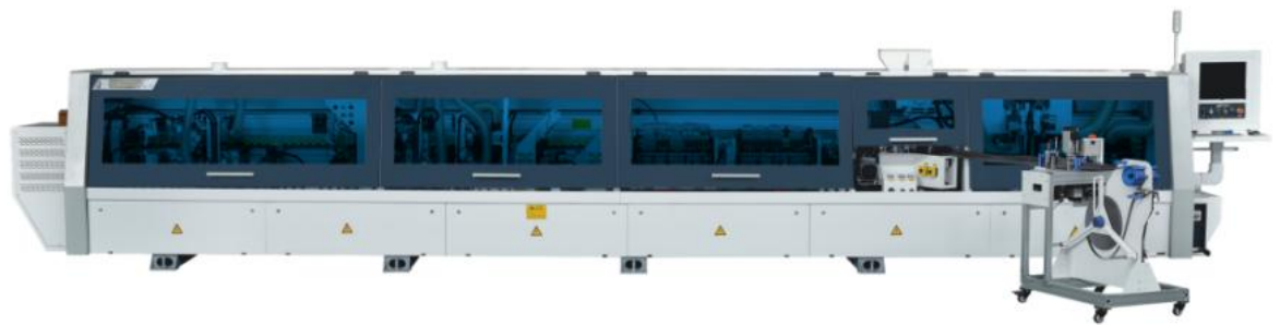
软成型自动封边机