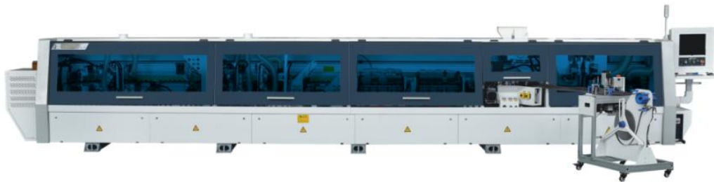
软成型自动封边机