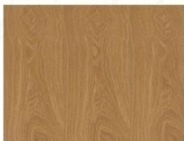
天然木皮饰面家具板