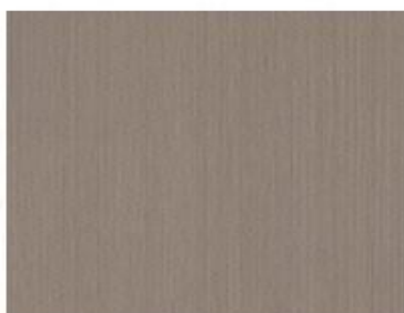
科技木皮饰面家具板