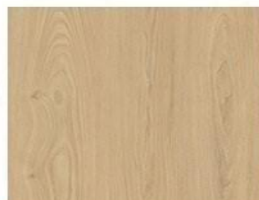
浸渍纸饰面家具板