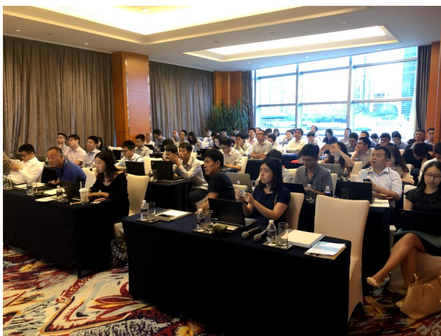
2019年9月5日，公司在上海举行路演活动