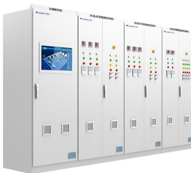
图 6：横琴新区智慧能源管理系统

国家成都新药安全性评价中心是目前国内规模最大的新药临床前研究技术服务的专业机构，对室内环境控制的稳定性和安全性有极高的要求，格力采用高效永磁同步变频离心机为核心的高效系统解决方案，得到用户的认可。目前，该技术已广泛应用于轨道交通、区域能源、数据中心、医药建筑、养殖业、酒店、写字楼等领域。