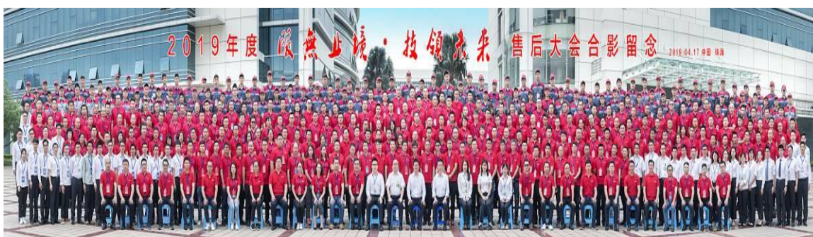
图 13：售后服务人员集中培训

2019 年度，公司组织开展 2019 “GlobalGREE 海外售后训练营”，巡回拉美、北美、东南亚、中东、欧洲等 39 个国家和地区。