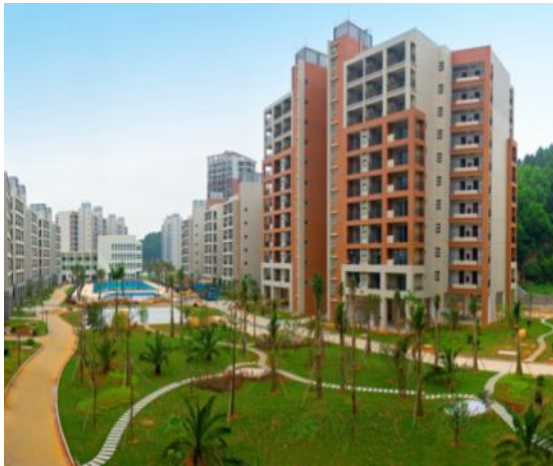
图 20：格力康乐园一期员工生活区图