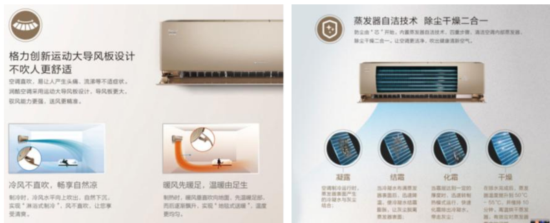
图 3：全新 Pular 分体机

的双导风板，优化气流控制，气流组织更加顺畅、合理，提升用户舒适感；全系列搭载的蒸发器自洁技术，为用户的健康保驾护航；采用简化的整体结构方案，实现无需打开面板即可清洗过滤网、快速分离扫风叶片、扫风连杆、导风板等，达到深度清洁风道、呼吸新鲜空气的目的。