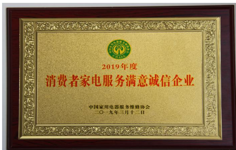
图 16：荣获“2019 年度消费者家电服务满意诚信企业”