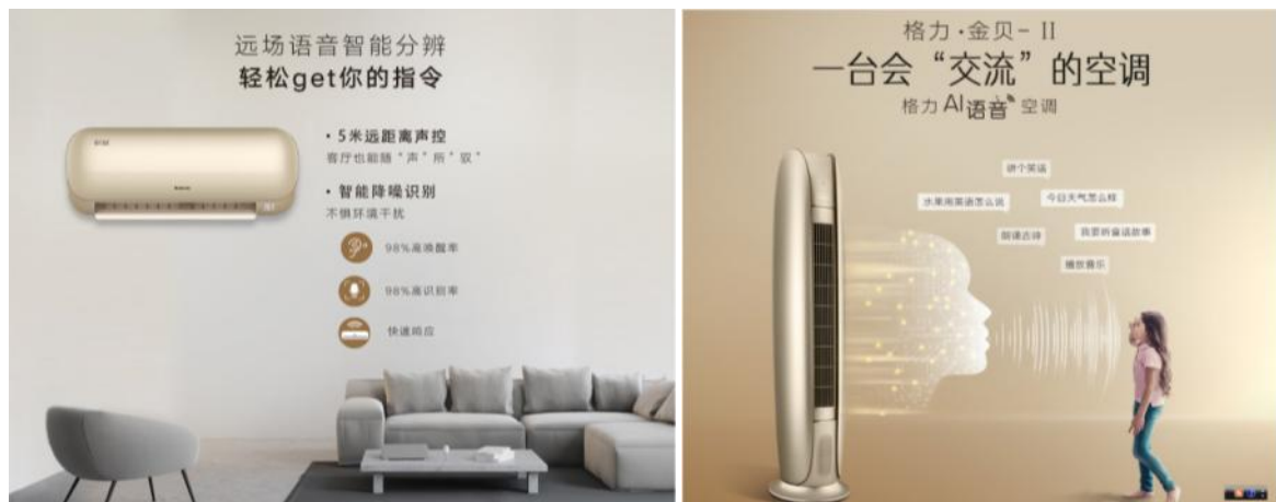
图 2：AI 语音智能空调“金贝”

针对手动遥控空调步骤多、不便捷的痛点，公司开发了物联网空调格力·金贝 II-柜机、金贝挂机（AI 语音款）系列产品，搭载 AI 语音技术，不必动手就能控制空调，还可进行音乐放送、新闻播报、百科查询、聊天等交互功能，还可以联动全屋家电，让空调成为家庭智能终端。