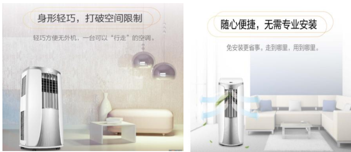
图 4：全新出口欧盟移动式空调

全新欧盟移动机，造型简洁，采用顶部大导风板设计，冷风不吹人，使用舒适。内部采用使用 T 型换热器布局架构，搭配双重冷凝水利用技术，提高制冷能效。采用 R290 环保冷媒，搭配自主品牌的高效压缩机和自主研发的渐进式扩压风道技术，使整机满足欧盟的环保要求及 A 级能效要求，既省电又舒适。