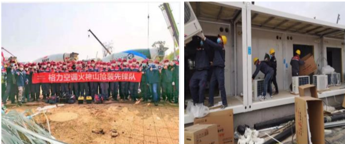
图 25：格力火神山抢装先锋队

在疫情鼎盛期间，各种防疫物资极度匮乏，格力电器积极协调各项资源，向珠海市人珠海市卫生健康局、民医院、中大五院、妇幼保健院等单位捐赠口罩近 5 万枚，协助医疗工作者做好人民健康的救护工作。