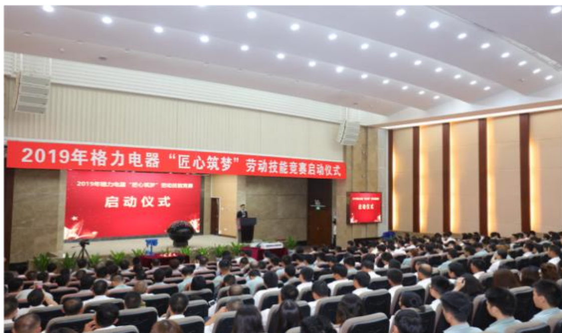
图 18：2019 年格力电器“匠心筑梦”劳动技能竞赛启动仪式

截至目前，全集团技能型人才突破 36600 人，其中 5000 余人评定为中、高级以上技师，多人获得“广东省技术能手、珠海市技术能手、珠海市岗位技术能手、珠海工匠”等称号。