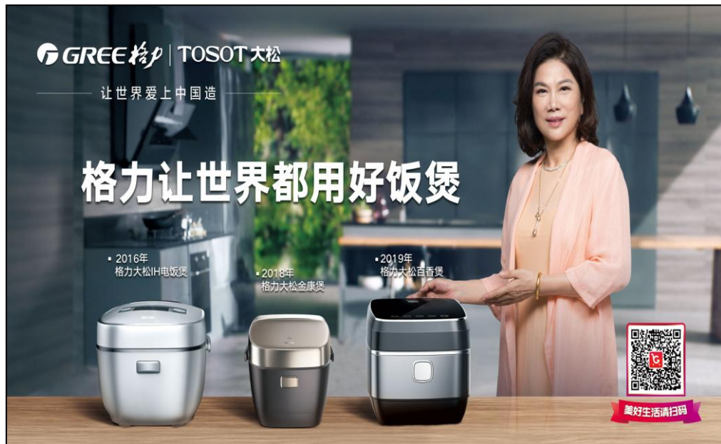
图 7：格力 IH 电饭煲

色煲仔饭、发芽糙米饭、快煮粥等特色功能，搭载多段 IH 技术和微压技术，实现米饭均匀烹饪效果。