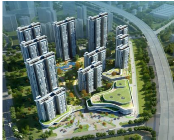
21：格力明珠广场人才公寓（在建）