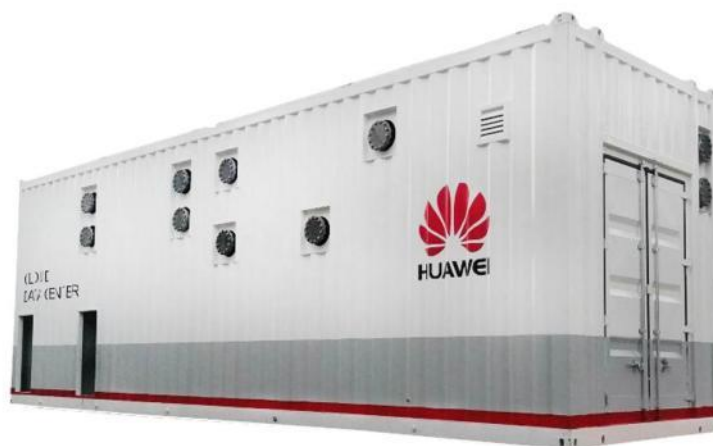
图 5：华为东莞云数据中心高效集成冷站

格力高效永磁同步变频螺杆机为东莞华为云数据中心二、三期项目分别提供 6×750RT 模块化高效集成冷站，实现工厂模块预制，即接即用，制冷机房整体能效达到 5.0 以上，施工时间缩短 80%以上。