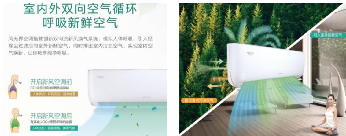
图 1：室内外双向换气的空调“风无界”

高，身体健康受到危害等痛点问题，开发了新风空调“风无界”挂、柜机，具有双向新风功能，既可以引入多重过滤后的室外新鲜空气，还同时排出室内污浊空气，能有效、持久地保持室内空气清新。空调内置空气质量传感器，可监测室内空气质量，新风系统智能开启或关闭，为用户带来便捷、健康的享受。