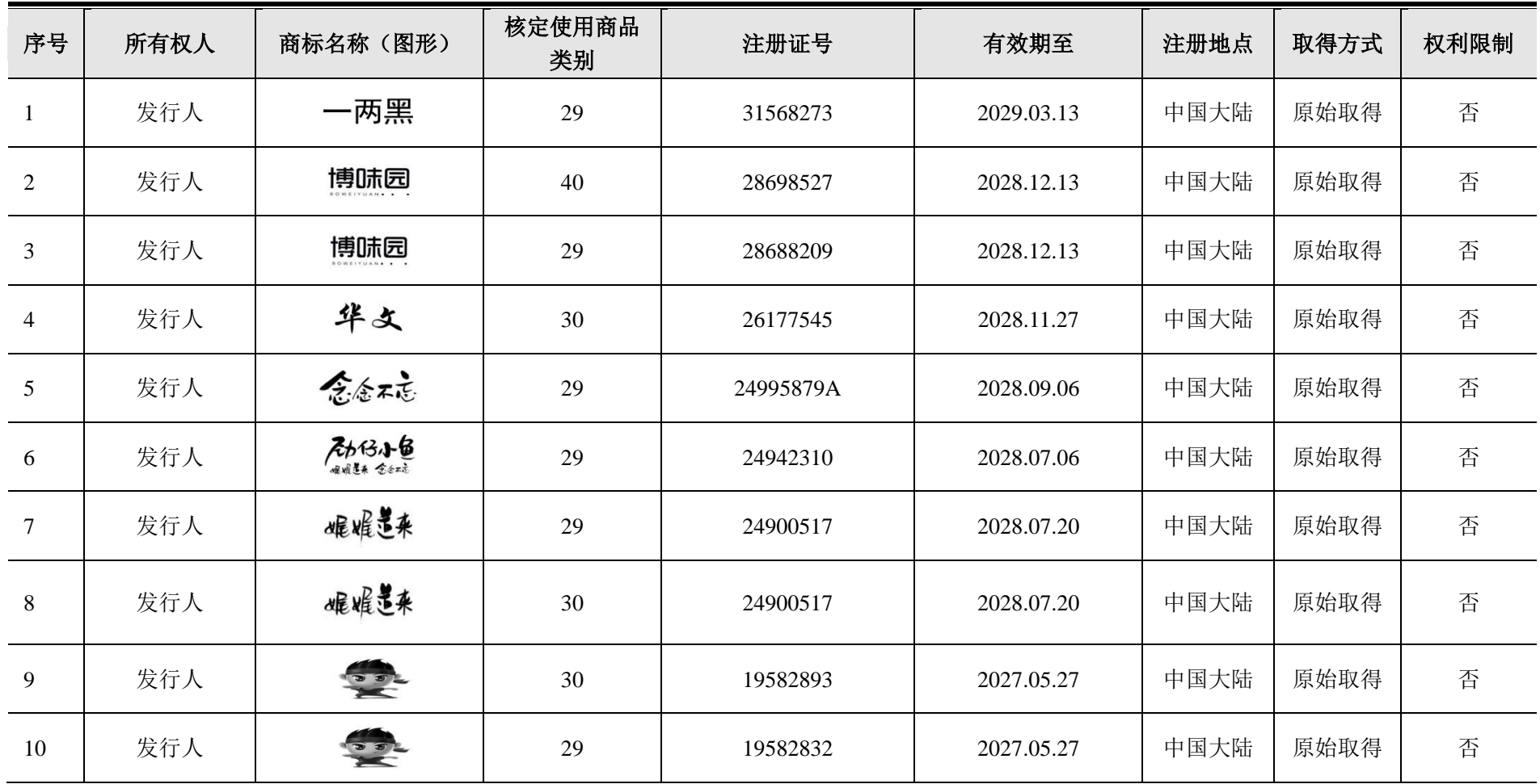
附件四：发行人及其子公司拥有的注册商标统计表