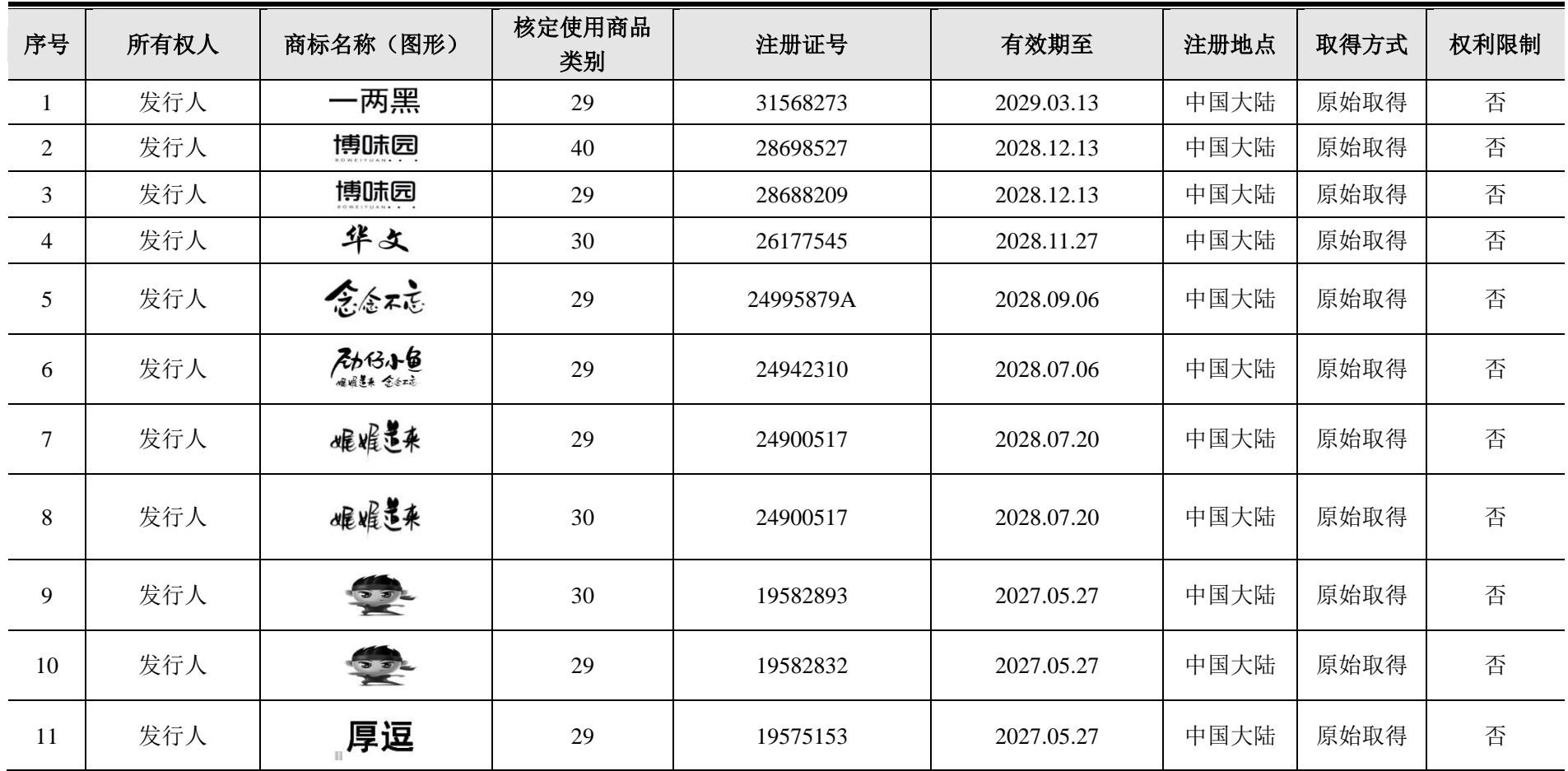
附件四：发行人及其子公司拥有的注册商标统计表