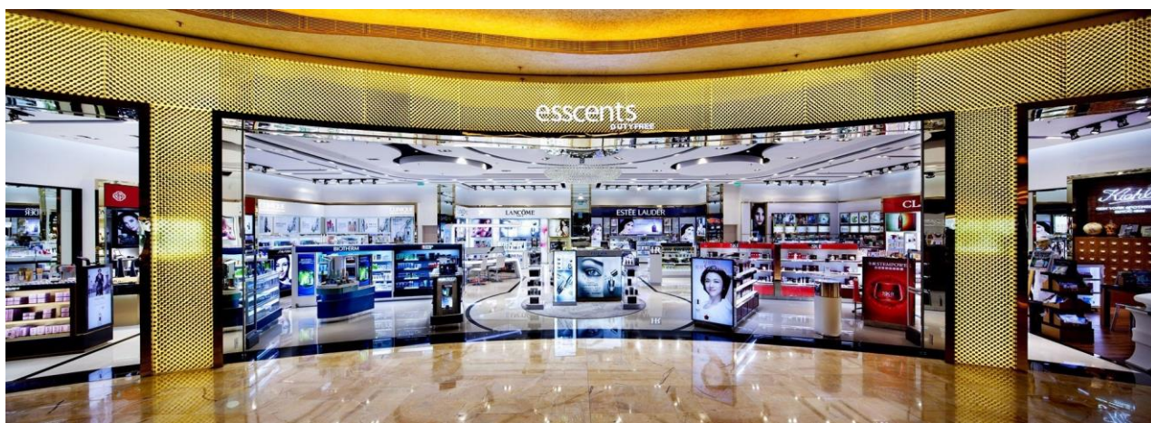
图：澳门金沙城中心ESSCENTS香化免税店