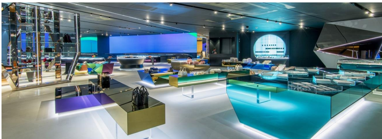
图：澳门巴黎人ANTONIA买手店

公司在澳门金沙集团旗下巴黎人、金沙城中心、威尼斯人设立多家商铺，开展国际一线品牌的代理业务。其中，位于巴黎人的顶级时尚买手店ANTONIA面积约1500平方米，合作国际品牌超过300个，包括：GUCCI、SAINT LAURENT PARIS、BALENCIAGA、BURBERRY、CHLOÉ、BALMAIN、VERSACE、SACAI、CALVIN KLEIN、VALEXTRA、KENZO、OFF-WHITE等奢侈品、潮牌；位于金沙城中心的香化免税店ESSCENTS获得了BVLGARI、GIORGIO ARMANI、ESTEE LAUDER、LANCOME、SHISEIDO、SK-II、YSL、HR、HUGO BOSS等国际品牌的授权；除此之外还有新秀丽箱包等知名品牌代理，以及DIRK BIKKEMBERGS品牌店。