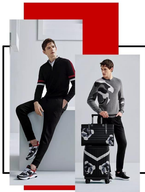
图：CANUDILO H HOLIDAYS广告大片