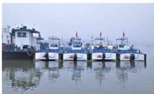
全自动保洁船作业