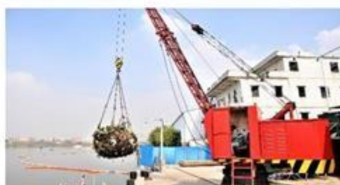
水域垃圾干燥、压缩