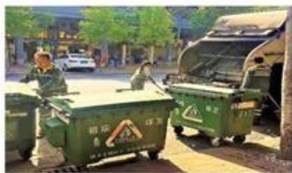
“沿途上料”并及时压缩