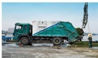
“集中收料”及时压缩