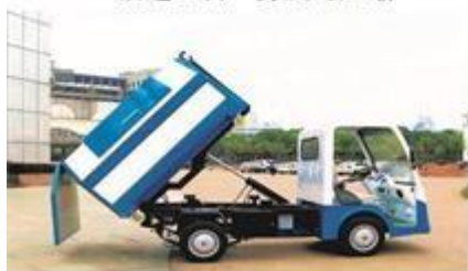
“以箱换箱”垃圾运输车