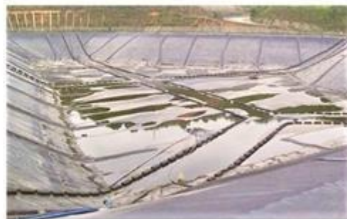
垃圾填埋场内渗滤液收集