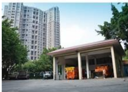
垃圾压缩中转站全貌