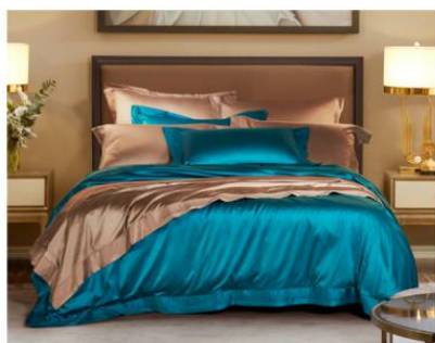
寝具 单套件、毯类等

公司聚焦以床上用品为主的家用纺织品业务，集研发、设计、生产、销售于一体，通过百货、品牌旗舰店、社区专卖店、购物中心、平台电商、直营电商（官网、小程序）、团购等线上、线下各销售渠道，以覆盖高端市场（廊湾、莱克星顿、内野）、中高端市场（罗莱、罗莱儿童）和大众消费市场（乐蜗LOVO、恐龙）的多品牌产品，满足不同类型的消费需求，同时不断探索“大家纺小家居”的家居场景化模式。除公司2017年收购的家具品牌莱克星顿Lexington的销售市场主要在美国以外，公司其他品牌产品的销售均以国内市场为主。