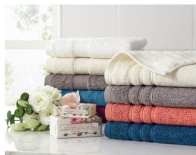
生活家居 家居鞋服、毛浴巾、卫浴用品等

品牌经营方面，突出“罗莱品牌连续16年床上用品综合占有率第一”、“乐蜗家纺LOVO中国互联网床上用品第一的品牌”，从品牌广告投入到市场营销落地到门店呈现都加以着重呈现，使“行业第一”的观念逐步深入消费者心智。同时以“超柔床品”作为产品特性，打破同质化竞争格局，打造具有超柔属性的特殊产品印记。报告期内，公司加大跨品牌合作力度，和高端床垫品牌慕思合作开发床垫品类并渠道共享；和高端热水器品牌史密斯合作水暖床垫，进一步拓宽了优质品牌间的合