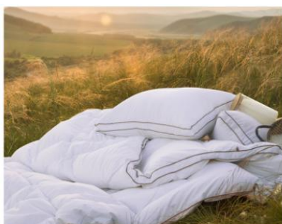
芯类 被芯、枕芯、床垫等