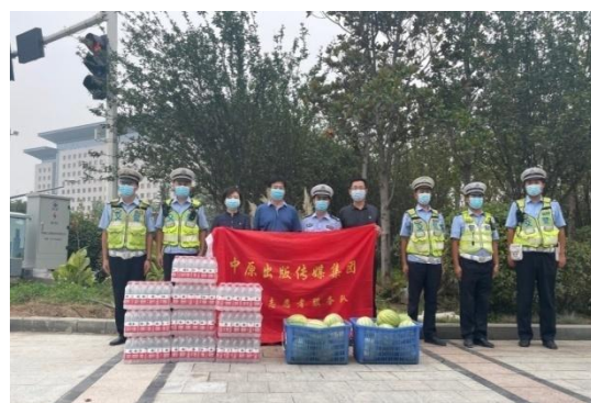
为防控一线人员“送清凉、献爱心”

二是闻“汛”而动，同舟共济抗击内涝灾害。面对“7·20”百年不遇的特大暴雨灾害，公司系统各单位齐上阵、同发力，全力点亮城市守望相助“灯火”。中原图书大厦、回声馆、郑州购书中心、万达书店、新乡市新华书店等门市 24 小时开放，为市民群众提供临时救助服务，为 3000 余名暴雨滞留被困群众免费提供热水、食物、无线网络和休息场所；出版单位迅速策划出版《洪涝灾害居民安全与健康防护手册》，组成志愿者服务小队投身社区救助、城市重建 2000 余人次；百姓文化云第一时间制作推广应急科普、防汛自救视频，整合