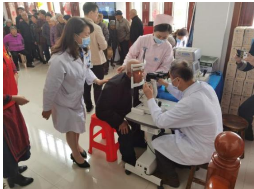
组织专业医疗结构为村民进行免费义诊

助打造“乡席”“旗袍秀”等文化活动，切实提升村民生活居住、文化娱乐环境，现已形成光山县乃至更大区域内的独特乡村文化现象。2019年9月17日，习近平总书记到东岳村视察，对东岳村脱贫攻坚成效给予肯定。2021年2月25日，在全国脱贫攻坚总结表彰大会上，荣获“全国脱贫攻坚先进集体”称号。