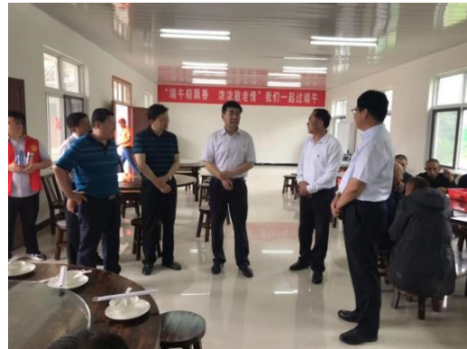
公司领导节日走访慰问指导扶贫工作

五是凸显国企社会形象，高质量完成文化援疆任务。 持续支持书香哈密和兵团第十三师建设，每年精心挑选出万余册精品图书捐赠给兵团第十三师，助力推进文化惠民工程、实现农家书屋全覆盖；坚持与哈密市委宣传部和兵团第十三师宣传部合作，协助建设“哈密文库”“红星系列丛书”等出版工程，为宣传新疆生产建设兵团精神、提高文化发展水平提供积极帮助。