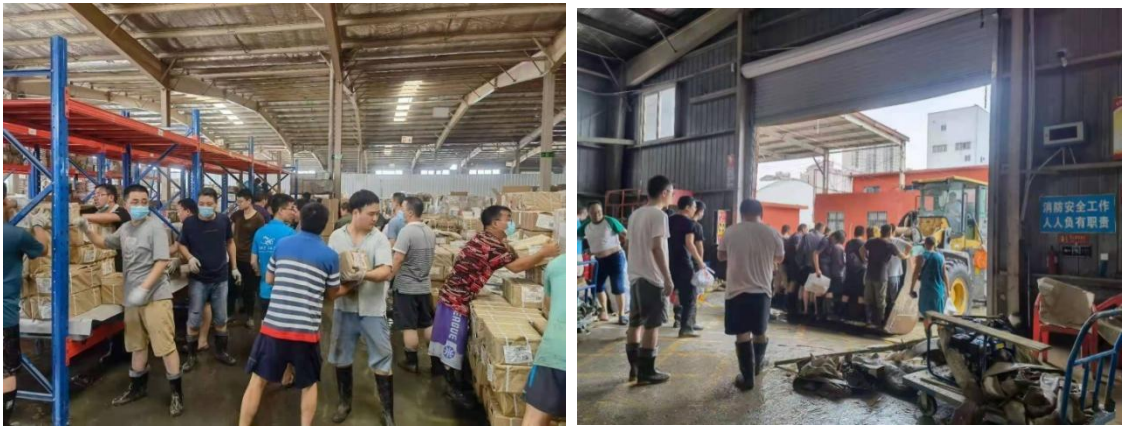
克服疫情和洪灾叠加困难，全力以赴保障“课前到书、人手一册”政治任务。

大党员干部职工不畏艰险、冲锋在前，不计成本、不讲代价，从严从细从实推动复工复产，按期完成 610 余万册《习近平新时代中国特色社会主义思想学生读本》印制任务，高标准完成了全省 1700 多万中小學生“课前到书，人手一册”的政治任务，免费开放“全省中小学数字教材服务云平台”等线上平台，积极为“停课不停学”做好服务保障。坚持服务不打烊，新华书店以“线上下单、一键到家”送书和直播活动，切实满足疫情期间人民群众的学习和文​​化生活需求。