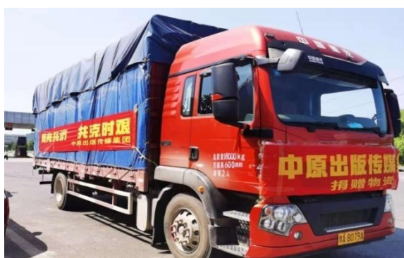
赴巩义市开展防汛救灾物资捐赠活动

防控要求，全面落实各项常态化疫情防控措施，通过官网、微信公众号、手机报等多形式渠道宣传科学防疫措施，组织志愿者参与社区联防联控工作，为防控一线人员捐赠矿泉水、西瓜、面包、牛奶、口罩、消毒液等防暑降温、防疫消杀物资，用心、用力、用情为全员核酸检测“保驾护航”。尤其是在光山县东岳村，公司驻村工作队采取发放传单、走访交流多种形式宣传科学防疫知识，积极推动村民疫苗接种，利用私家车接送没有交通工具和行动不便的农户到卫生院接种疫苗，先后为派驻村购置应急发电机、红外测温仪、口罩、酒精、消毒液、一次性手套等防汛防疫物资。