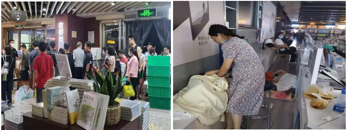
为暴雨受灾群众提供救助服务

三是心怀“国之大者”，积极解难纾困。积极响应政府号召，确保房租减免相关政策贯彻落实到位。及时制定疫情和水灾期间房租减免实施计划，全面摸清底数，主动排查承租房产的企业、个体工商户情况，建立台账并及时上报，对符合房租减免政策的，积极与对方沟通协商减免事宜，按规定办理相关手续，做到应减尽减、应免尽免，支持中小企业、个体工商户平稳度过疫情难关。截至 2021 年 12 月 31 日，全年共为 315 家中小微企业和个体商户减免租金 912.17 万元，彰显了国有企业的政治站位和责任担当。