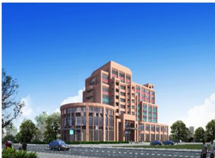
（上图为：妇产医院综合大楼）

公司在母婴消费服务端的业务布局逐步清晰，业务框架基本明确，未来，公司将借此打破发展瓶颈，提升在母婴领域全方位的综合竞争力。