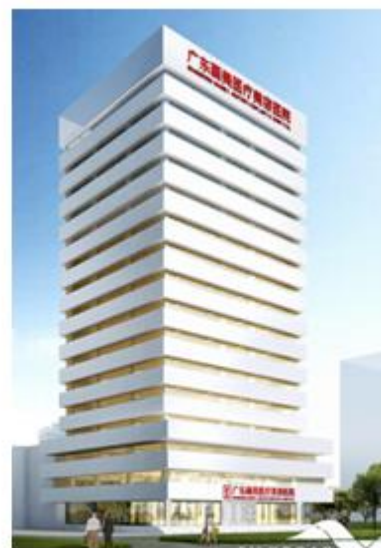
（上图为：广东韩妃医美整形医院）