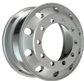
图3：锻造铝合金轮毂（适用于高端商用车型、新能源车型、特种车辆）