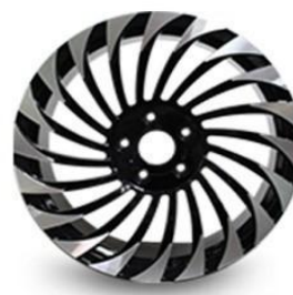
图4：乘用车锻造铝轮（新开发产品，适用于改装车）