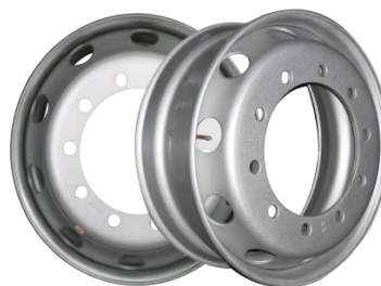
图2：轻量化无内胎钢轮（适用于轻量化商用车型）