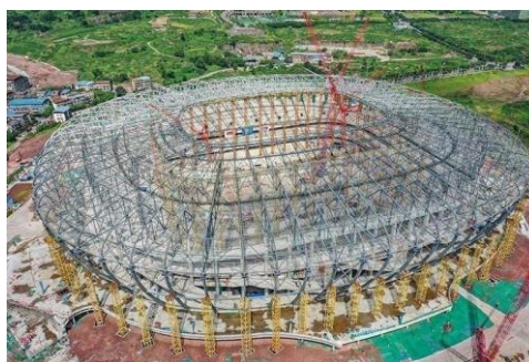
图8：NCC钢结构应用于体育场馆