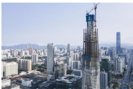
图7：NCC钢结构应用于超高层建筑