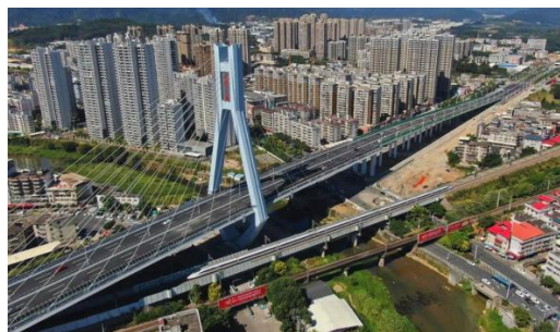
图6：NCC桥梁钢结构应用于跨线桥