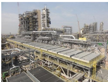
图5：NCC石化钢结构应用于炼油领域