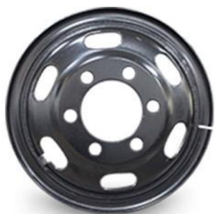
图1：型钢钢轮（适用于特殊路况重载车型）