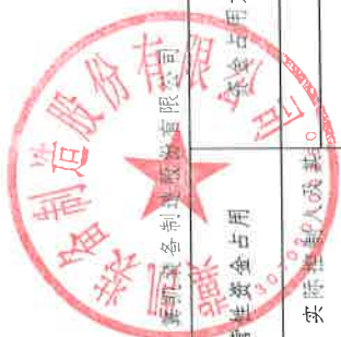
冀凯装备制造股份有限公司2021年度非经营性资金占用及其他关联资金往来情况汇总表