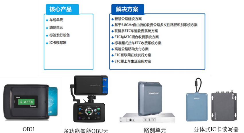
图一：智慧高速业务核心产品和服务

公司智慧高速核心产品包括车载单元（OBU）、路侧单元（RSU）、标签发行设备、IC读卡器等，可为客户提供智慧公路建设方案、基于5.8GHz自由流的收费公路多义性路径识别系统方案、联排多ETC车道收费系统方案、ETC与MTC混合收费系统方案、标准厢式货车ETC收费系统方案、高速公路移动支付方案、ETC互联网在线发行方案、ETC掌上车生活应用方案等解决方案服务。