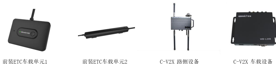
图三：智慧网联业务核心产品

目前公司智慧网联业务主要是向客户提供对应的软、硬件系统解决方案和技术服务，主要设备有前装ETC车载单元、C-V2X车载单元、C-V2X路侧设备、高性能专用短程通信（DSRC）模块等，可为客户提供V2X车载端解决方案、道路全息感知平台等全系统搭建服务。