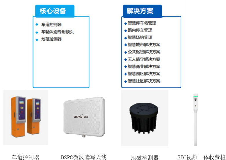
图二：智慧城市业务核心产品和服务

公司智慧城市业务主要为停车场、交通管理运营单位提供智慧停车场管理、路内停车管理、智慧场站管理、ETC智慧加油等系统方案，使用的核心设备包括车道控制器、DSRC微波读写天线等。