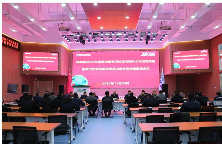
公司规范化治理专项检查与提升治理质量工作会议

率先响应，周密部署，层层推进。2020 年 11 月 19 日，深圳证监局举办辖区提高上市公司质量大会。2020 年 11 月 22 日，公司第一时间响应并发出《关于开展 2020 年度经营规范治理专项检查与提升公司治理质量的通知》，成立以公司董事长为组长的公司经营规范化专项检查与提升治理质量工作组，启动开展公司治理专项检查与提升行动，针对不同业务板块制定了详细的工作计划，召集公司董监高、财务部、内审部、证券部等相关人员以及各业务板块管理人员分别在深圳、武汉、江西、江苏、荆门召开五场动员会，从时间、空间上层层推进，按照目标与计划完成自查、整改、验收等工作。