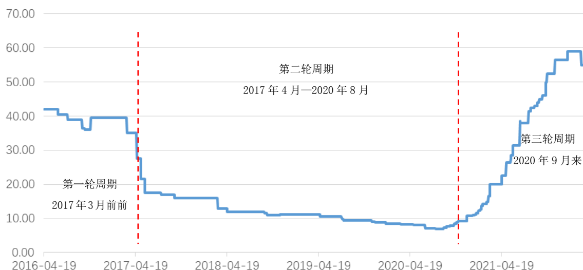
2016年4月-2022年3月中国六氟磷酸锂均价（单位：万元/吨）

2020 年下半年以来，随着新能源汽车需求的复苏， \text{LiPF}_6 供需趋紧，价格持续走高。六氟磷酸锂价格呈现周期性波动明显，自 2020 年 9 月开始出现反弹，从 8.85 万元/吨上涨至 56.50 万元/吨，涨幅高达 538.42%。