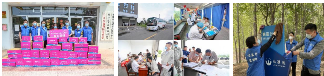
图：联泓新科公益活动图选

公司积极践行“分享共赢”的企业文化，在企业发展的同时让广大员工分享企业发展的成果，共同建设富有社会责任感的企業。