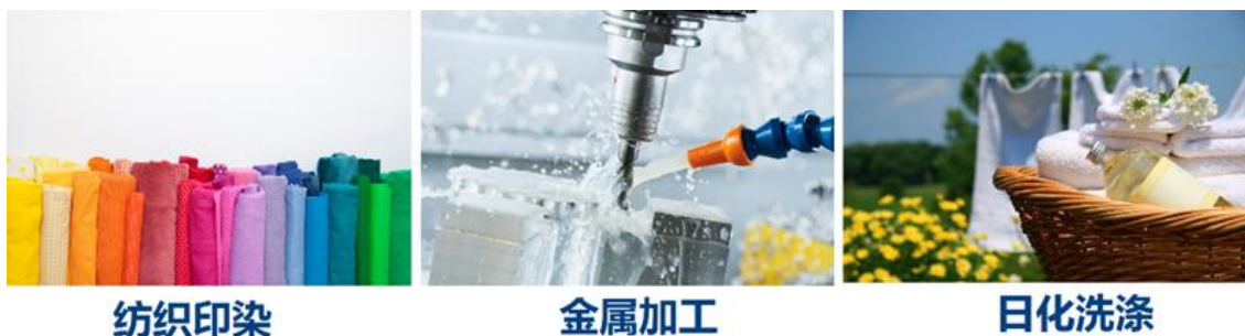
图：特种表面活性剂应用场景

公司 EOD 生产装置采用意大利 D. B. I. 公司第五代 PRESS 工艺技术，产品聚焦特种表面活性剂、聚醚单体、高性能减水剂等下游方向，应用前景广阔。公司在相关产品应用领域具有较强的产品开发、应用服务和市场营销能力，广泛应用于日化、纺织、建筑、路桥、光伏、金属加工、农化、涂料、汽车、皮革等领域。目前公司 EOD 主要产品为特种表面活性剂、聚醚大单体、高性能减水剂。公司生产非离子表面活性剂、聚醚大单体的工艺流程概括为：起始剂→前处理→加入环氧乙烷进行烷氧化反应→后处理→成品存储→切片→包装→非离子表面活性剂、聚醚大单体；生产聚羧酸减水剂的工艺流程概括为：聚醚大单体+其它单体+引发剂→聚合反应→复配→聚羧酸减水剂。