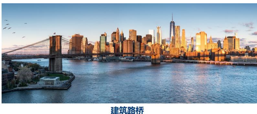
图：高性能减水剂应用场景