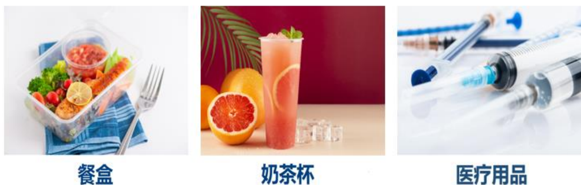
图：PP 专用料应用场景

公司 PP 专用料生产装置采用国际领先的陶氏化学公司（Dow Chemical）Unipol 工艺，产品聚焦于高附加值的高端专用料方向，广泛应用于食品包装、汽车、家具、光纤电缆、建筑、医疗等。目前公司 PP 专用料产品主要为薄壁注塑 PP 专用料、高熔无规共聚 PP 专用料、高透明 PP 专用料。公司生产 PP 专用料的工艺流程概括为：丙烯、乙烯→反应→脱气→挤压造粒→风送→包装→PP。