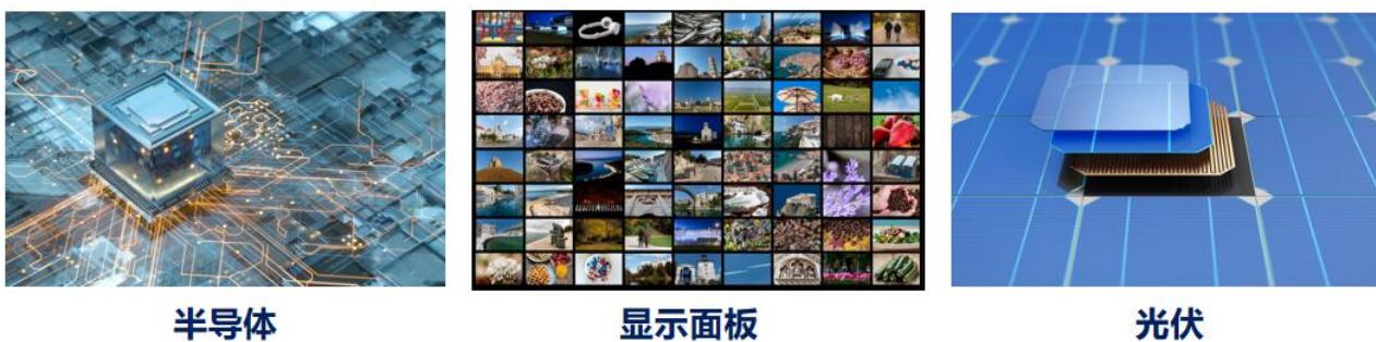
图：电子特气应用场景

公司电子特气生产装置采用自有专利技术工艺，产品为电子级高纯氯气 (CL 2 )、高纯氯化氢 (HCL)，主要用于半导体芯片制造过程中的蚀刻、镀膜、掺杂、清扫等工序。公司电子特气生产流程概括为：液氯→提纯→电子级氯气；氯气+氢气→合成氯化氢→提纯→电子级氯化氢。