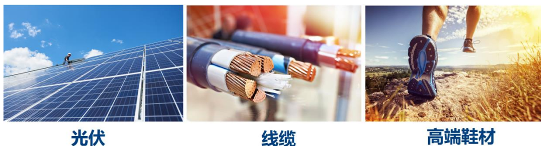
图：EVA 高端料应用场景

公司 EVA 生产装置采用国际领先的埃克森美孚公司（Exxon Mobil）釜式法工艺，产品聚焦于高附加值的高端产品，尤其是国内需要大量依赖进口、生产难度较高、附加值较高的高 VA 含量产品，处于行业领先水平，广泛应用于光伏胶膜、电线电缆、高端运动鞋、热熔胶、涂覆膜等领域。目前公司 EVA 产品主要为光伏胶膜料、电线电缆料和高端鞋材料等高 VA 含量的高端产品。公司生产 EVA 的工艺流程概括为：乙烯、醋酸乙烯→压缩→反应→挤压造粒→风送→包装→EVA。