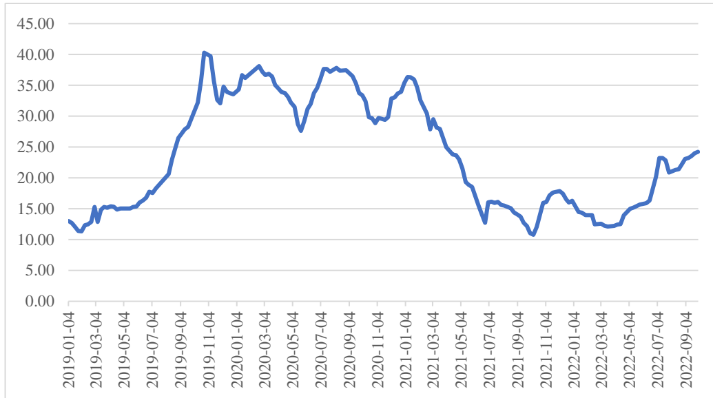
2019 年-2022 年 9 月全国 22 个省市生猪平均价格（元/千克）

我国生猪价格的周期性波动特征明显，一般 3-4 年为一个波动周期。报告期内，我国 22 省市生猪平均价格变动情况如下：