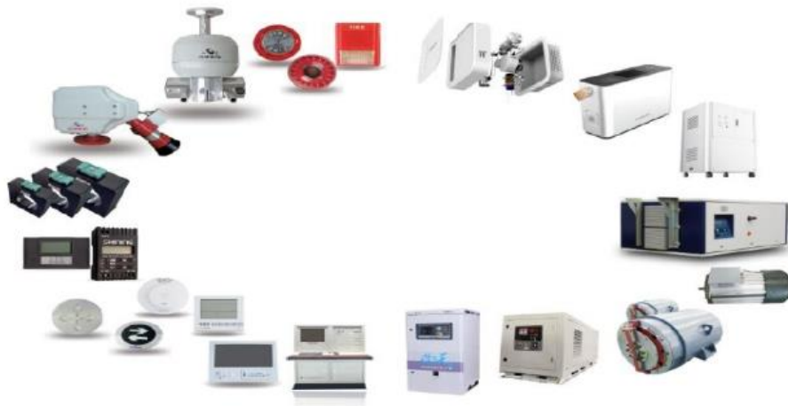
电力电子装备示意图

电力电子装备依托于全资子公司山鹰报警，主要产品有火灾报警系统、智能应急照明和疏散指示系统、监控探测系统、自动跟踪定位射流灭火系统、智慧消防软件平台等 16 个系列 411 种型号,并提供典型行业应用解决方案。