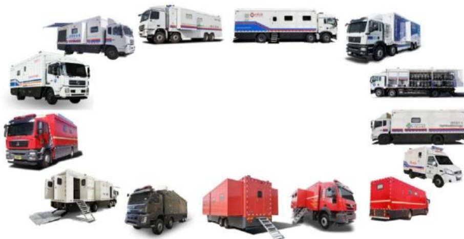
移动医疗保障装备示意图

移动医疗装备是公司战略培育板块，经过多年探索发展，凭借保障装备领域研发技术优势，产品性能达到市场领先，已受到多家医疗机构认可。该业务是公司重要的潜力板块，主要包括围绕着应急救援体系移动医疗应急救援装备、围绕着心脑血管领域新技术转化小型家用预防筛查治疗的医疗器械和制氧设备。移动方舱医疗车从开始的单一产品（体检车）发展到至今，现已形成检验、影像、门急诊、手术、重症监护、防疫、后勤保障七大作业单元，具备先进的设计理念、成熟的制造工艺以及强大的特殊舱体研发能力，目前已经成为业内领先的方舱医疗车专业制造厂家，产品涉及 6 个系列 11 种型号，在体检车、移动生物安全实验室（检测车）、移动手术车、DSA 手术车、微增压氧舱车、移动 CT 车、移动卒中单元等产品市场具有优势。现已具有配置全科甲级移动医疗和医疗应急处置能力，产品也正在向高端智能方向发展。制氧设备采用先进的“多层分子筛塔”技术，持续提供高纯度氧气，适用于各类医疗机构、民用中心供氧、高海拔地区、工矿企业等，主要产品包括医用分子筛制氧系统产品、高原弥散供氧制氧机、便携制氧机、车载制氧机等 4 个系列 30 中产品。