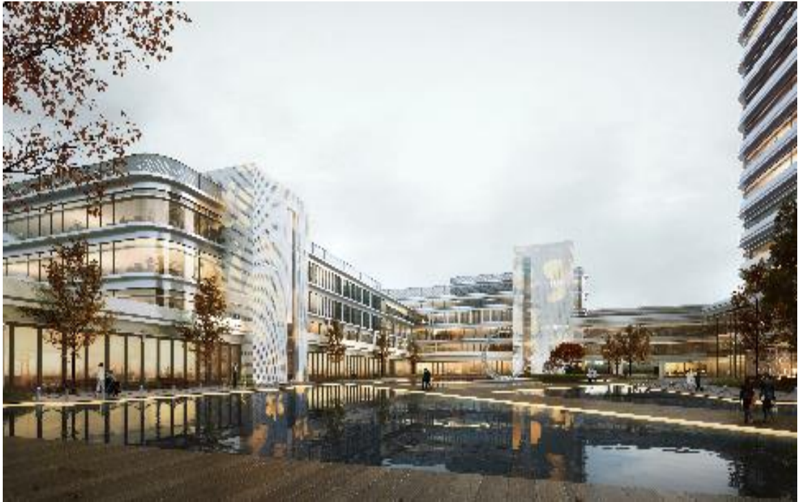
图为肯尼亚国家转诊和现代医疗研究医院项目

肯尼亚国家转诊和现代医疗研究医院项目： 建筑面积约 16 万平方米，公司从质量、安全、管理上严格把关，努力打造精品项目。项目建成后，将为肯尼亚人民提供更好的医疗条件，进一步提高肯尼亚人民的幸福感。