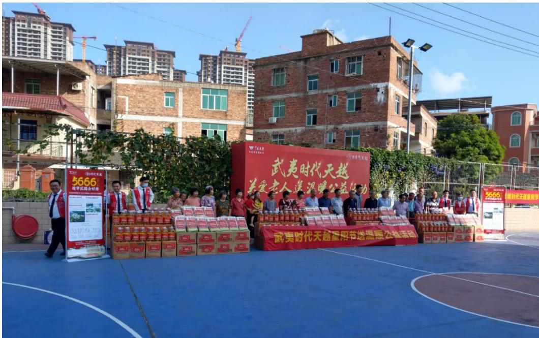
南安泛家开展重阳节关爱老人志愿活动

(3) 南安泛家置业有限公司通过志愿服务、公益送考、重阳送温暖等活动，在特殊的时期对受益人群提供了贴心服务，得到了社会公众的一致认可。