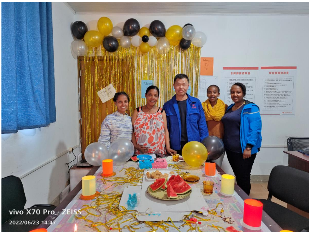
图为阿拜银行大楼项目部组织与当地员工一起欢度埃塞新年

工作的决策部署，提供不低于 50% 的岗位招聘应届生，为毕业生创造就业条件，积极履行企业社会责任。积极响应教育部开展“访企拓岗促就业”专项行动，参加福建工程学院等院校组织的校企座谈会，并邀请学院老师实地参观公司，进一步深化校企合作，树立良好的雇主品牌形象。在海外，公司始终遵守所在地劳动用工的法律法规，尊重人权，奉行平等、非歧视的劳动用工政策，平等对待不同种族、国籍、民族、性别、年龄、宗教信仰的员工，反对各种形式的就业歧视和强迫劳动，与员工建立平等规范的劳工关系。