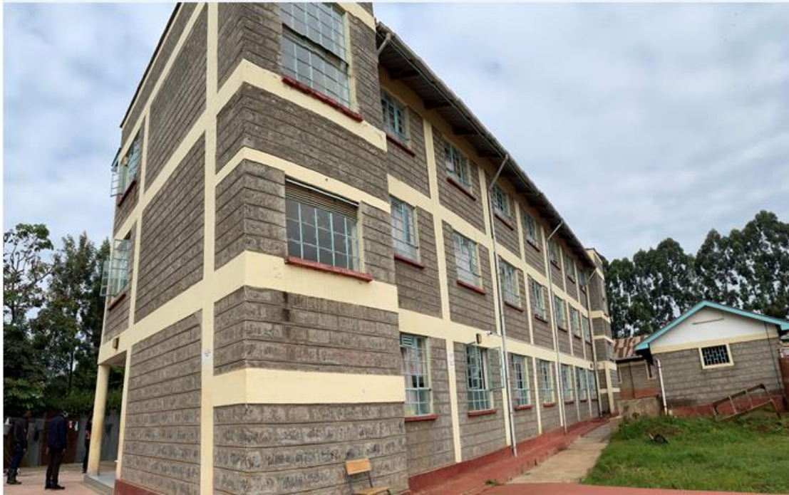
中国武夷为肯尼亚恩夏汝女子寄宿学校捐筑的三层宿舍楼

3. 加快推进本土化进程。 融入当地社会、推进本土化是实现中国武夷境外业务可持续发展的重要推手。公司积极配合各个境外业务所在国别市场政策的用工要求，聘用和培训当地雇员人数已超过 6,000 人。