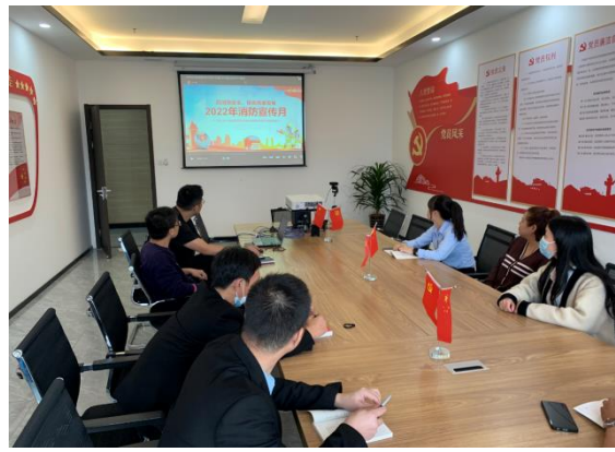
肯尼亚茂威公路安全检查 南