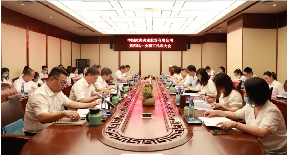
图为中国武夷第四届一次职工代表大会