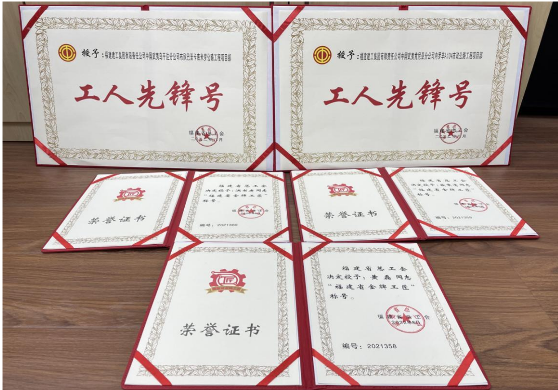
图为福建省总工会授予的项目部及员工荣誉称号