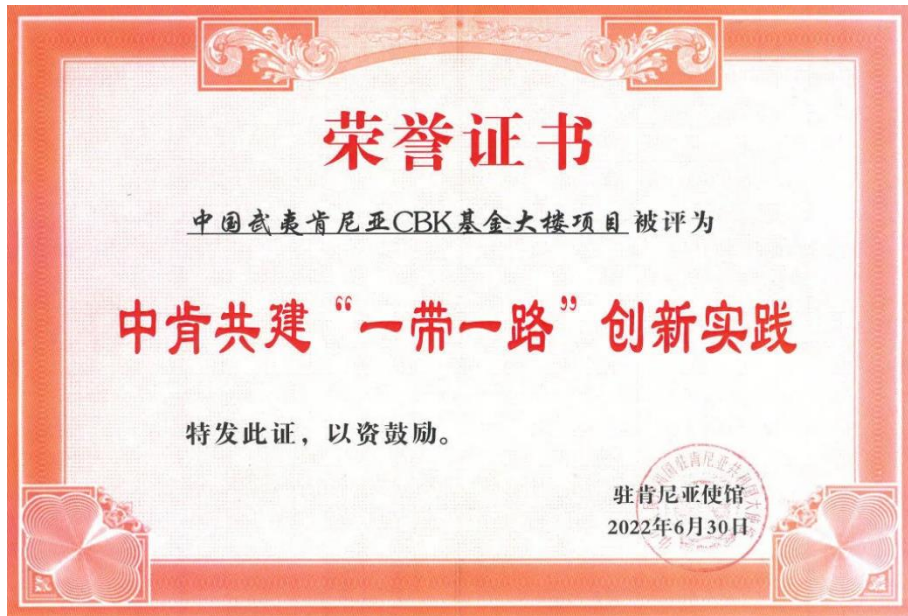
图为中国驻肯尼亚大使馆为中国武夷肯尼亚 CBK 基金大楼项目颁发的中肯共建“一带一路”创新实践荣誉证书

银行社保基金大楼耸立在蓝天白云之下，为内罗毕中央商务区增添了新的亮点景观，刷新了内罗毕的城市天际线，为当地经济社会发展注入鲜活力量。