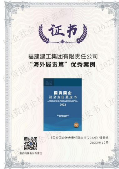
图为减贫案例获奖证书