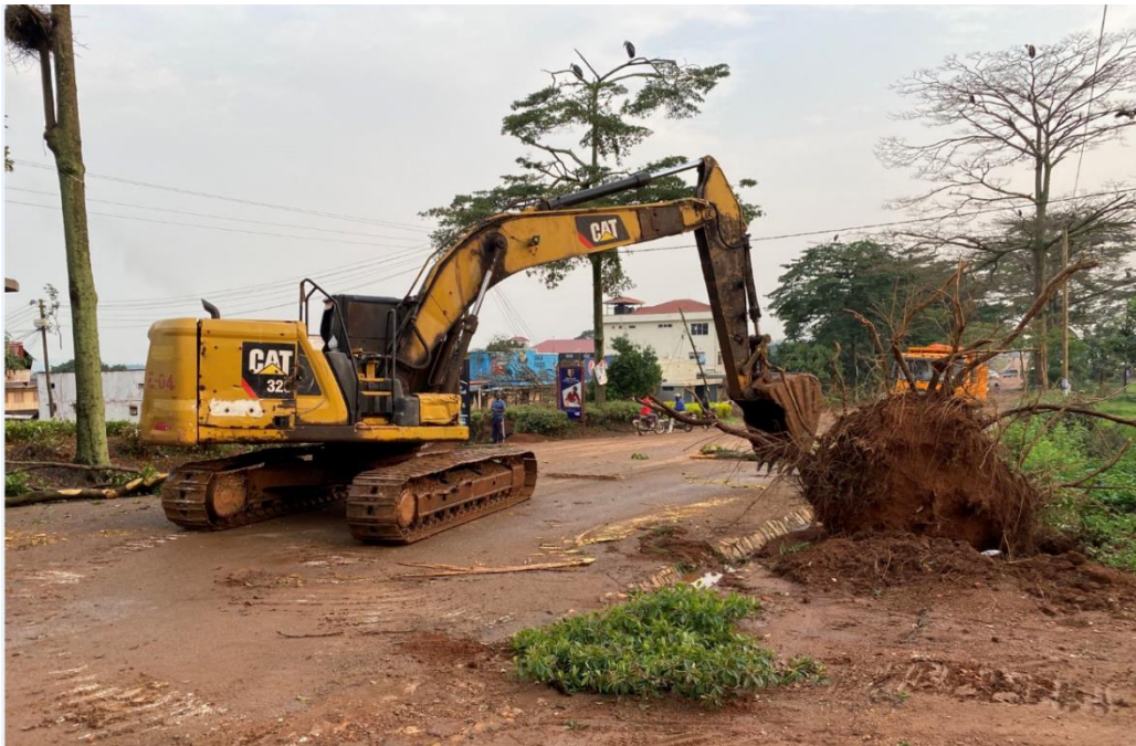
达恩德培项目部帮助清除因大风刮倒的树木，恢复交通

(2) 乌干达恩德培项目部附近的动物园，遇到旱季粉尘很大，项目部用洒水车定期给动物园义务洒水，共计洒水 15 次。2022 年 10 月，恩德培项目附近公共用树被狂风刮倒，项目部帮助清理刮倒树木，清除安全隐患。