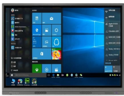
交互式白板一体机

IOT 智能显示终端产品：产品集成计算能力、多点触控、网络连接、音视频采集能力于一体的设计，可在家庭、办公、商业、教育、车载显示及医疗等多领域广泛应用。