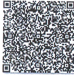
续更生的年检二维码

本证书经检验合格，继续有效一年。 This certificate is valid for another year after this renewal.