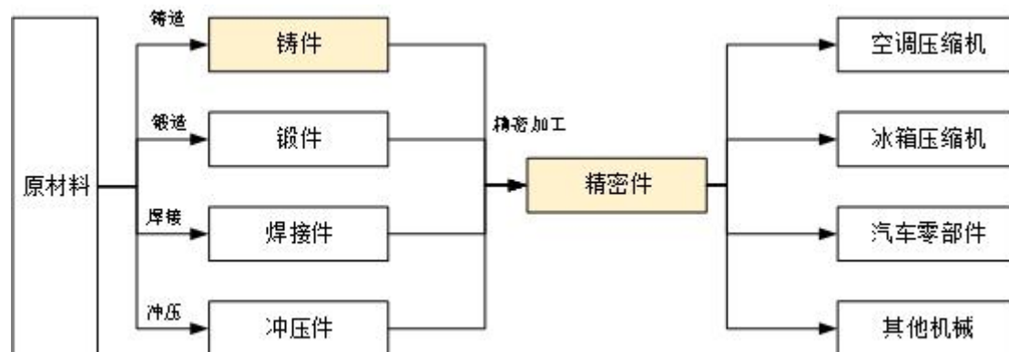
图：机械零部件产业链

从生产工艺来看，精密机械零部件首先通过铸造、锻造等方式形成相应的铸件、锻件等，再通过精密加工等形成符合特定设备功能需求的零部件。