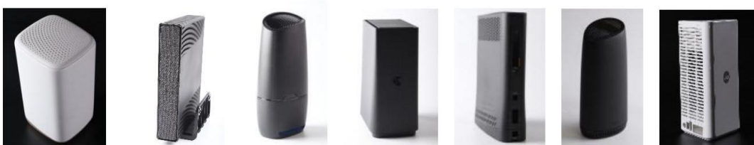
图 9: 智能机顶盒、网通网关组件系列