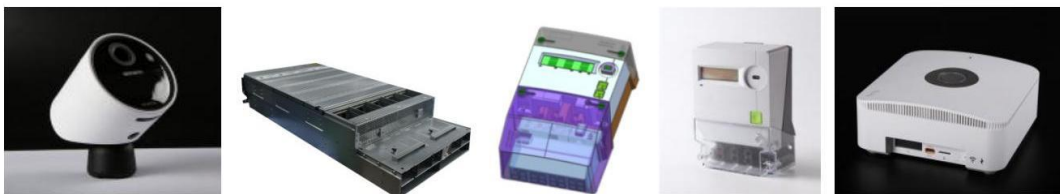
图 10: 智能安防、智能电表及其他组件