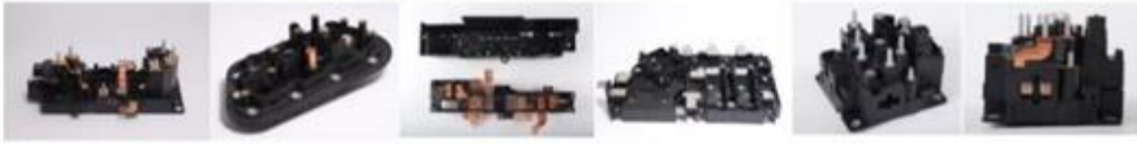
图 6: 电池镶嵌组件系列