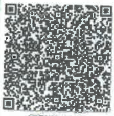
注册会计师年检二维码

本证书经检验合格，继续有效一年。 This certificate is valid for another year after this renewal.