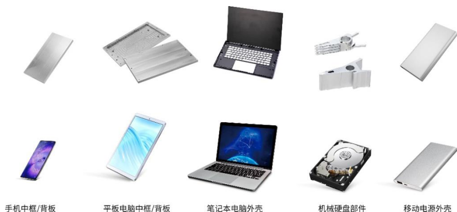
消费电子业务图示