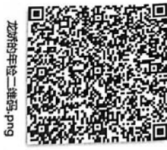
龙娇的年检二维码.png