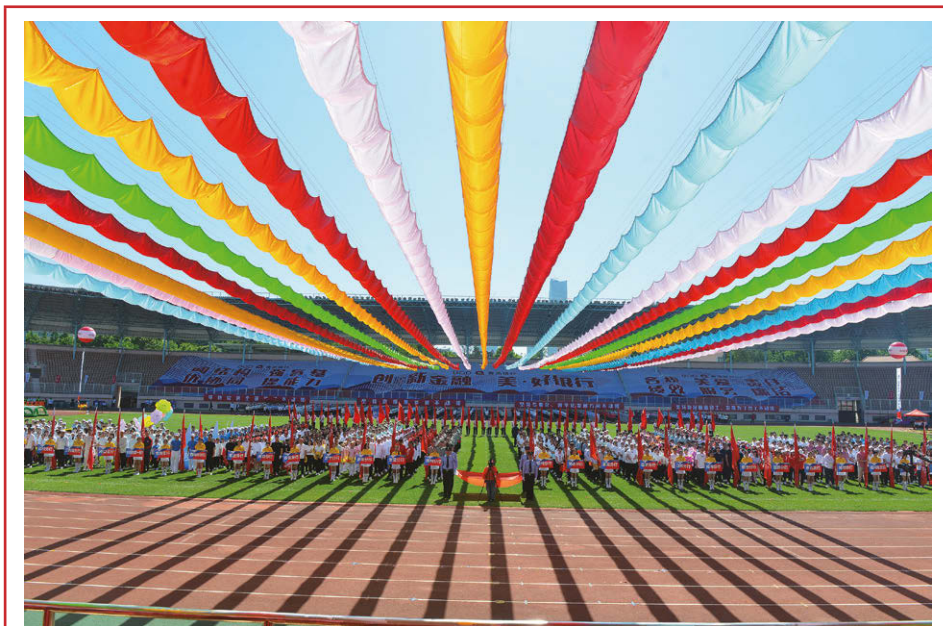
2023年6月，本行舉行2023年職工運動會，奏響職工體育文化團結、友誼的華美樂章。

報告期末，本行擁有在行式自助銀行97家，擁有自助設備415台，包括自助取款機11台、存取款一體機273台、自助查詢機119台、現金櫃員機12台，為客戶提供取款、存款、轉賬、查詢以及繳費等銀行服務。報告期內，本行自助設備交易506.45萬筆，交易額167.92億元。