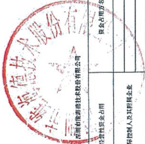
2023年度非经营性资金占用及其他关联资金往来情况汇总表